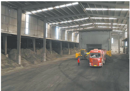
大易科技平台车辆在企业仓库准备卸货