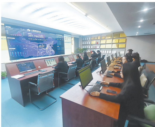
大易科技调度中心

为了保证业务真实合规,大易科技在司机、货主入驻注册时对企业及人员证照、车辆资质等进行多重审核,还建起司机信用体系,让货主更轻松地找到靠谱司机;通过物流全流程的信息协同,应收应付自动生成,费用明细清晰,可快速进行线上对账结算。这实实在在地帮助司机群体实现了收入提高,困扰货主的找车难、在途监管难、各环节协作难等问题也都迎刃而解。