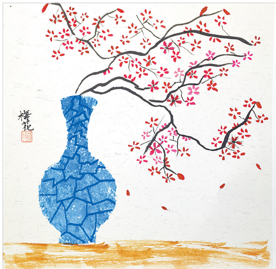
梅花 建东小学三(4)班 贺子墨