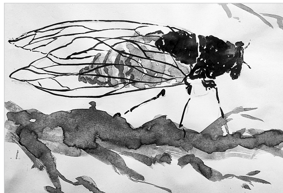
秋蝉 轻工路小学五(2)班 王妍柔 指导老师:张燕