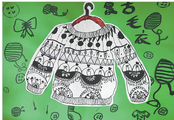
复古毛衣 矿工路小学二(1)班 王思斯