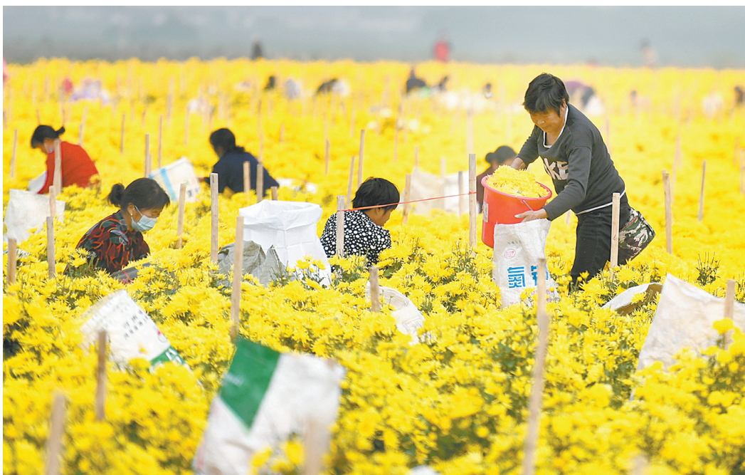
鲁山县一菊花种植基地，人们忙着采摘菊花