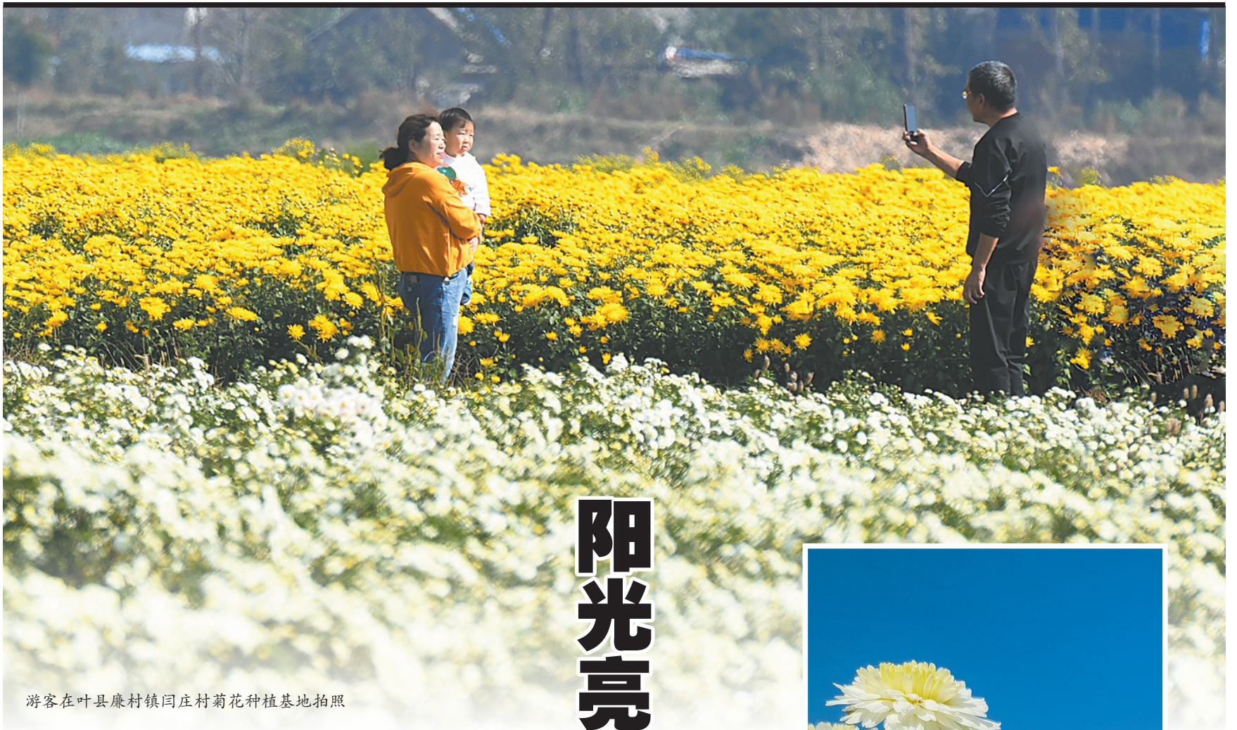
游客在叶县廉村镇闫庄村菊花种植基地拍照