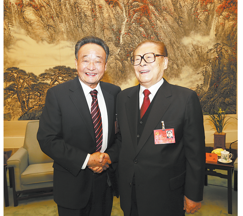
2012年11月14日，中国共产党第十八次全国代表大会在北京闭幕。这是闭幕会前，江泽民同志与吴邦国同志在一起。