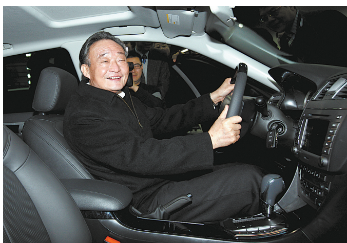
2010年1月30日，吴邦国同志在上海汽车集团股份有限公司技术中心察看新能源汽车。