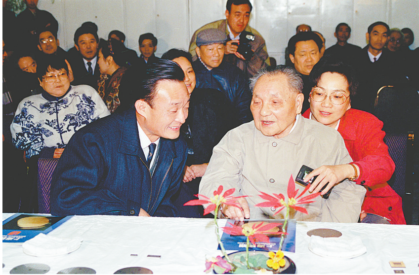
▲1992年2月10日，邓小平同志在上海贝岭微电子制造有限公司参观时与吴邦国同志交谈。