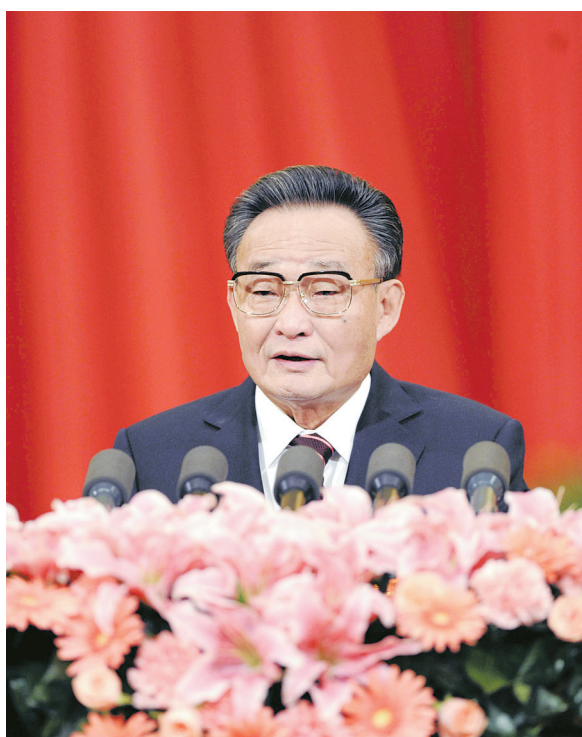
▲2011年3月10日，十一届全国人大四次会议在北京人民大会堂举行第二次全体会议。吴邦国同志作全国人民代表大会常务委员会工作报告。