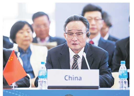
▲2013年1月28日，吴邦国同志在俄罗斯符拉迪沃斯托克出席亚太议会论坛第21届年会，并作题为《坚持和平发展 促进合作共赢》的主旨发言。