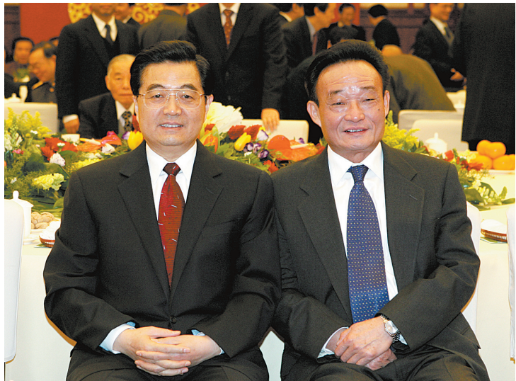
2005年1月1日，全国政协在北京举行新年茶话会。这是胡锦涛同志与吴邦国同志在一起。