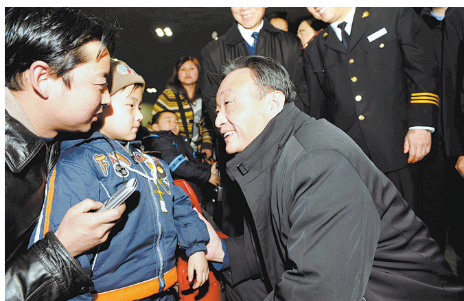
2008年2月3日，吴邦国同志在北京西站候车室与旅客交谈。