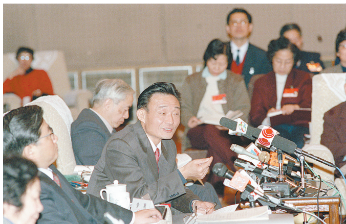
1994年3月，时任上海市委书记的吴邦国同志在全国两会上上海代表团全团会议上。