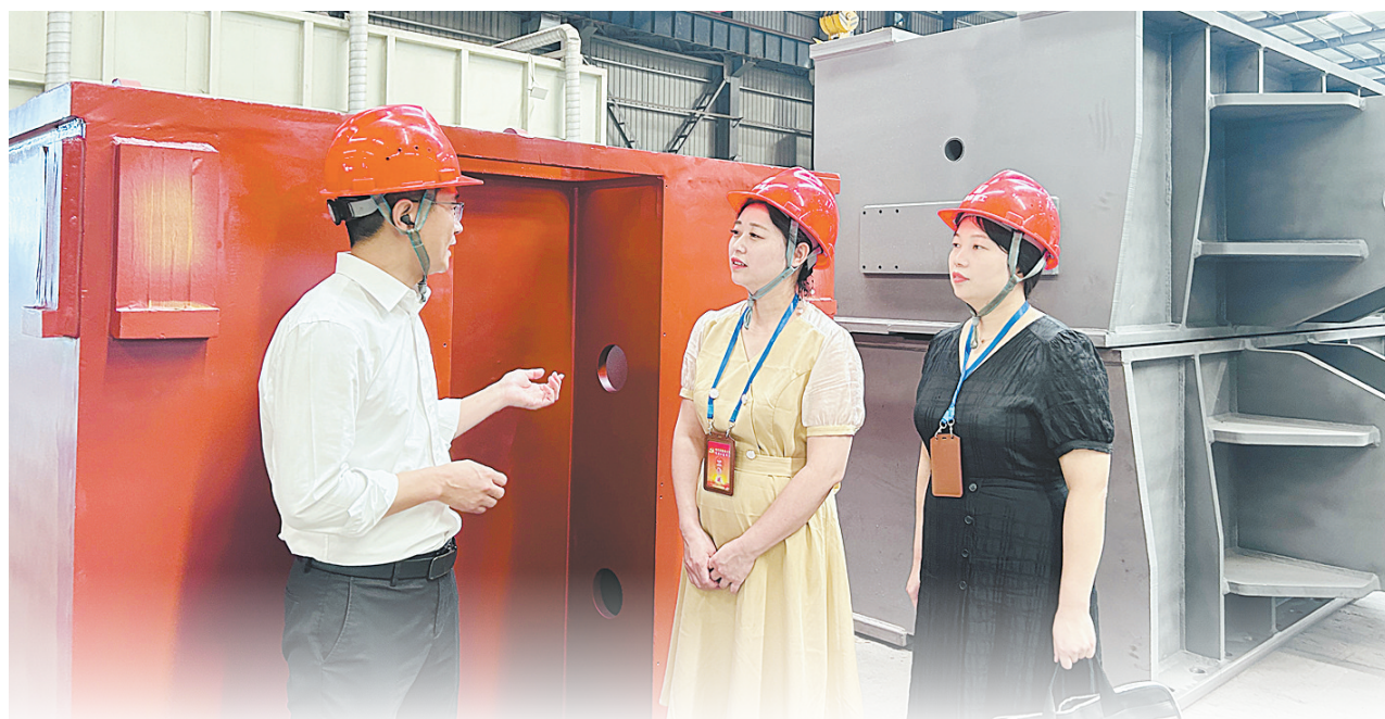
帮助企业解决实际困难

2021年以来，舞钢公司先后完成风电安装船桩腿用177.8mm厚齿条钢及配套半圆板供货5.5万吨，支持国内17条大型风电安装船桁架式桩腿的建造，国内市场占有率达85%以上，特别是供货于国家某部委国产化示范性项目的210mm厚齿条钢，突破厚度规格极限，彰显了该公司在海洋工程用钢领域的领先实力，提升了海洋工程建设向海图强的信心和入海远征能力。