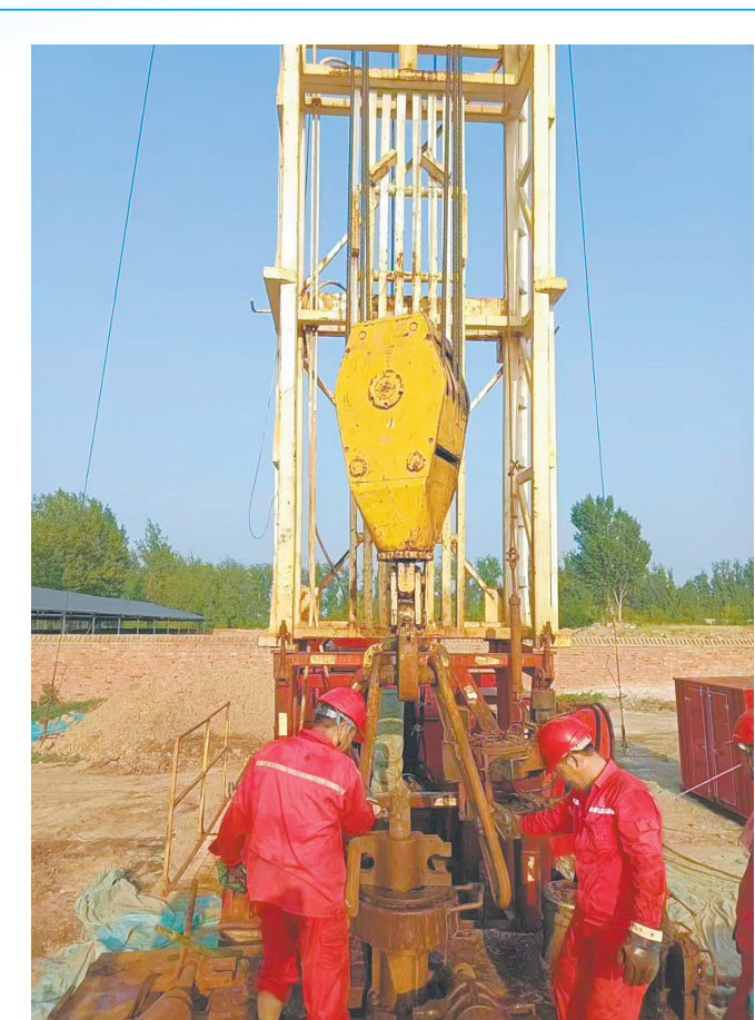
施工人员在修复盐腔(资料图)

“200兆瓦压缩空气储能电站项目开工,意味着我们的盐腔储能项目向前迈出了坚实的一步。”9月17日,平顶山晟光储能有限公司(以下简称晟光储能)总经理王文德说。