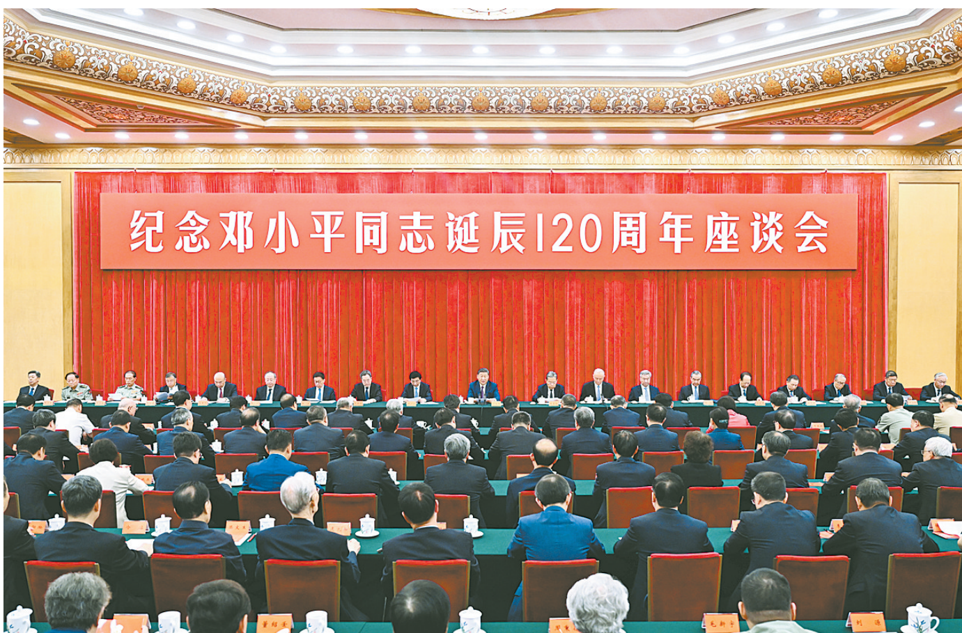
8月22日,中共中央在北京人民大会堂举行纪念邓小平同志诞辰120周年座谈会。习近平、赵乐际、王沪宁、蔡奇、丁薛祥、李希、韩正等出席座谈会。

新华社北京8月22日电 中共中央22日上午在人民大会堂举行座谈会,纪念邓小平同志诞辰120周年。中共中央总书记、国家主席、中央军委主席习近平发表重要讲话。他强调,邓小平同志是全党全军全国各族人民公认的享有崇高威望的卓越领导人,伟大的马克思主义者,伟大的无产阶级革命家、政治家、军事家、外交家,久经考验的共产主义战士,党的第二代中央领导集体的核心,中国改革开放和现代化建设的总设计师,中国特色社会主义道路的开创者,邓小平理论的主要创立者,为世界和平和发展作出重大贡献的伟大国际主义者。他对党、对人民、对国家、对民