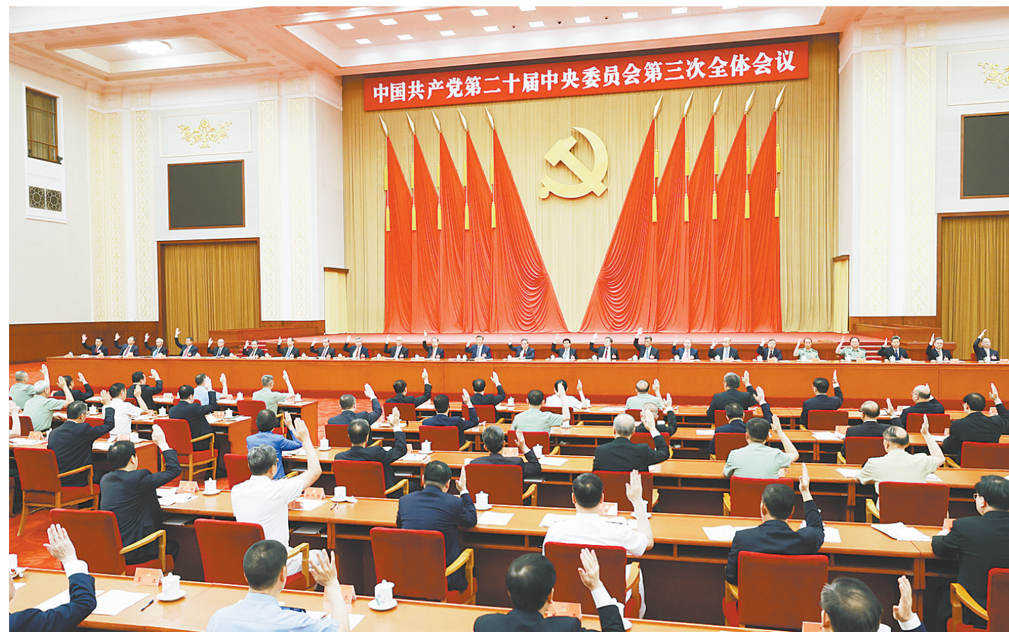
中国共产党第二十届中央委员会第三次全体会议,于2024年7月15日至18日在北京举行。中央委员会总书记习近平作重要讲话。