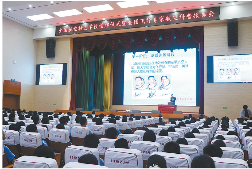
科普专家在为同学们作航空科普报告

市科协副主席李国军表示，“全国航空特色学校”的创建，对于普及航空科技知识，培养热爱航空及国防