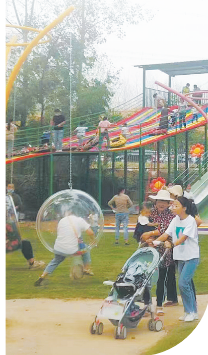
孩子们在儿童乐园玩耍

7月2日,位于舞钢市龙泉湖南岸的朱洼村荷叶田田,几名游客在树荫下系上吊床、甩出钓鱼竿,尽享惬意时光。