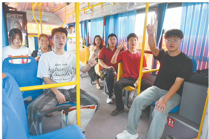
6月7日,叶县考生免费乘坐公交前往参加高考。

该街道联合县相关部门开展宗教、教育、文物古建筑等行业消防安全演练培训,通过普及消防安全知识、现场实操使用灭火器、模拟演练火灾现场疏散逃生等实训实演,提升群众逃生避险能力;对占用、堵塞、封闭疏散通道、安全出口和消防通道等安全隐患,开展专项排查整治;坚持电动自行车安全隐患集中夜查与日常安全隐患排查相结合,清理违规停放电动自行车;开展拆窗破网行动,对人员密集场所影响逃生和灭火救援的防盗窗、铁栅栏、广告牌进行拆除,确保生命通道畅通。