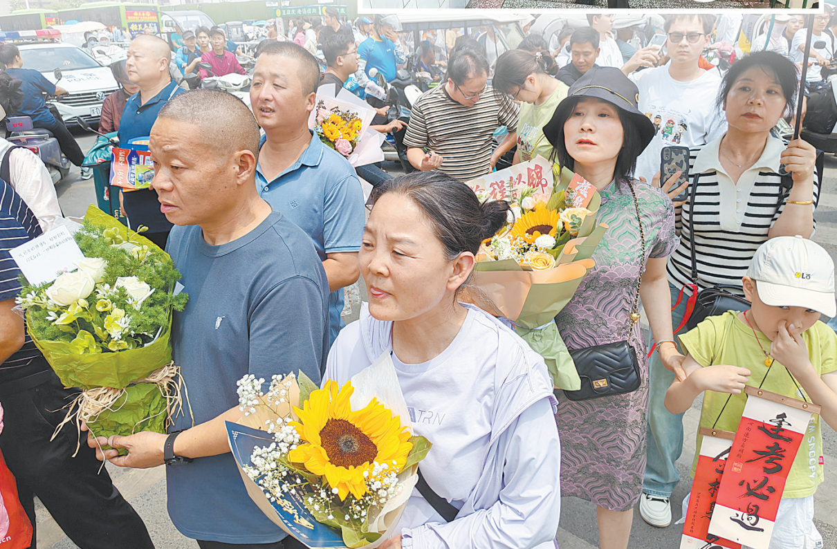
6月7日上午11时30分许,家长手捧鲜花迎接考生。