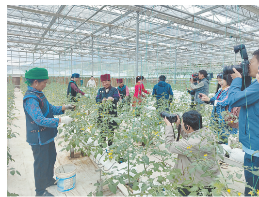
媒体记者在涪昭现代农业产业园区了解凉山特色农业产业发展情况