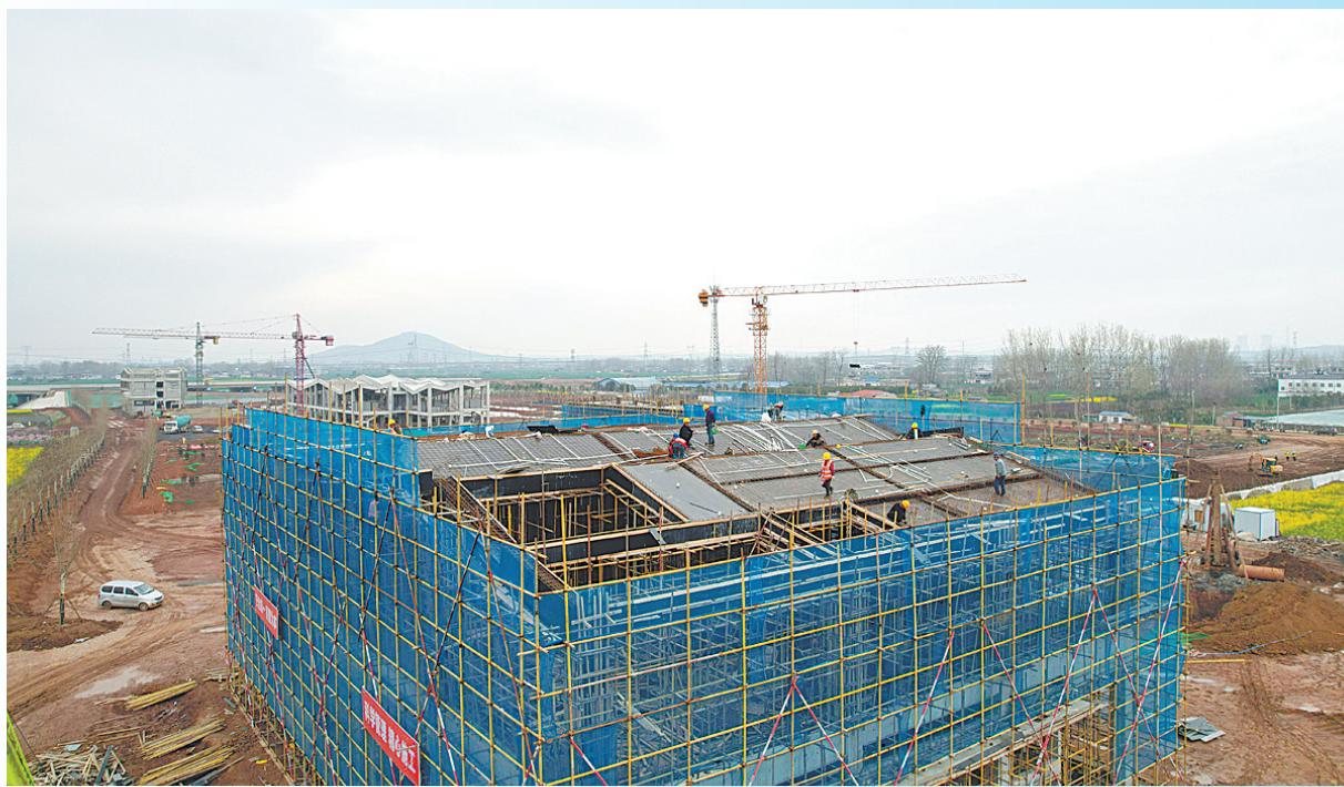
3月26日,中铁四局施工人员在 该服务区建设用地上228.7亩(亩=666.67平方米),分两期建设,目前一期(除加油加气站外)主体已完成施工,二期结构施工完成约60%。