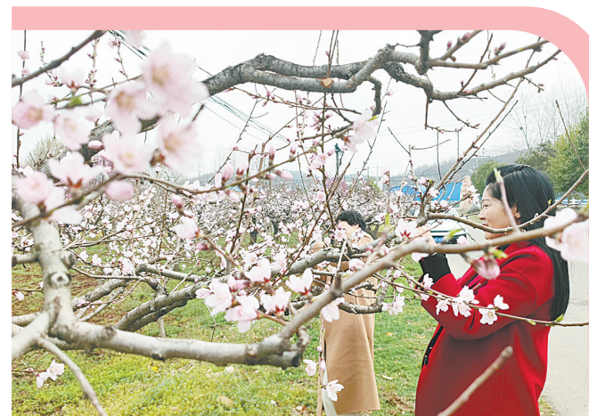
3月26日,熊背乡大年沟村血桃花盛开,吸引不少游人前往游玩。近年来,熊背乡党委、政府坚持以绿水青山助推产业发展,

鼓励村民种植血桃,为村民铺就了致富路。每年桃花盛开时,大年沟村就成了网红打卡地。