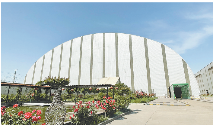
实施超低排放改造后,舞钢公司投入8800万余元,新建一座现代化封闭料仓,内配智能抑尘系统,并在进出口安装了自动洗车系统。图为改造后的料仓。

经收集、脱硫脱硝处理后,达到超低污染物排放标准,再经两根40米高的烟囱释放。一旁的重点污染源自动监控公示牌上不仅标明了监控因子“颗粒物、温度、压力、流速、湿度、二氧化硫、氮氧化物”等内容,还写着排污口编号,这意味着企业主动戴上了“紧箍咒”——此处全天24小时的排放数值不仅被系统自动记录,而且所有数据还与生态环境部、省生态环境厅实时联网,随时接受监督。