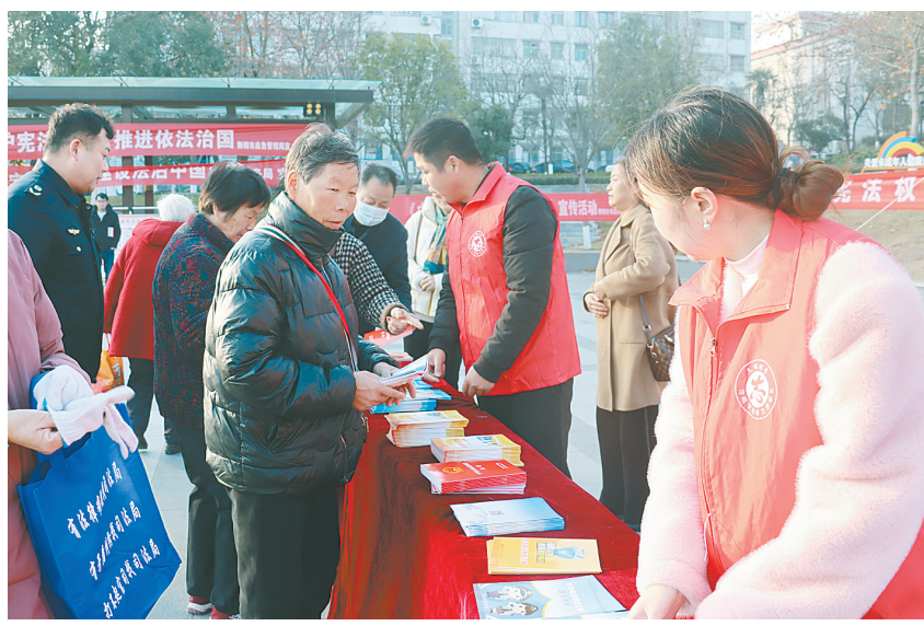
我市开展“宪法宣传周”普法活动(资料图片)

立善法于天下，则天下治。我市持续加强重点领域立法，专门制定《平顶山市人民政府规章制定程序规定》