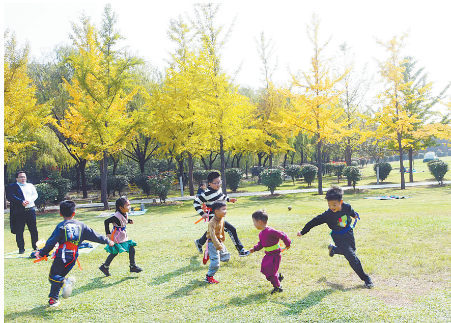
孩子们在秋日的白龟湖国家湿地公园草坪上玩耍(资料图片)

值得关注的是,我市着力提升生物多样性,扎实推进湿地保护、修复和可持续发展,已恢复湿地面积129万亩,汝州汝河湿地公园成功创建为国家湿地公园,舞钢石漫滩国家湿地公园顺利通过验收,白龟湖国家湿地公园修规工作启动,为我市创