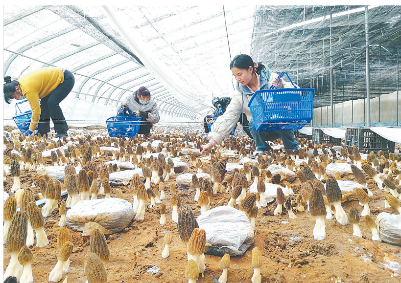
湛河区曹镇乡银王村村民在收获羊肚菌（资料图片）

1月12日，行走在鹰城大地，漫步村落房舍间，只见道路宽敞整洁，花草树木交相辉映、文化广场设施齐全。近年来尤其是过去一年，全市上下深入贯彻落实习近平总书记对“千万工程”的重要指示批示精神，以“千万工程”经验为引领，积极谋划开展“十百千万”和美乡村建设行动，出台方案，建立“市统筹、县主导、乡负责、村实施”四级联动机制，成立工作专班，常态化督导考评，推进各项重点工作落实落地，向美而行，共赴和美之约。