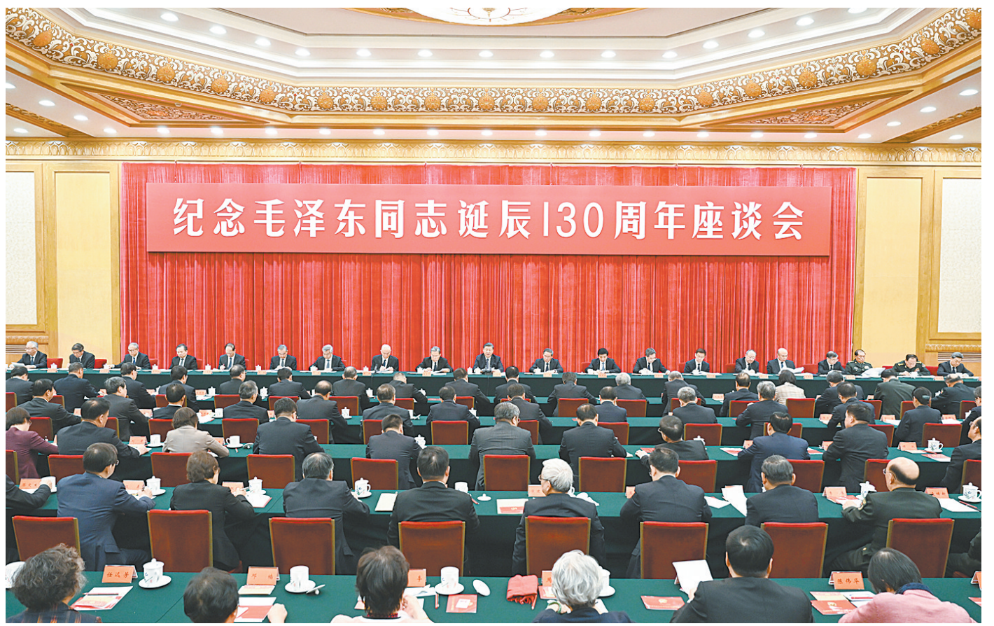
12月26日,中共中央在北京人民大会堂举行纪念毛泽东同志诞辰130周年座谈会。习近平、李强、赵乐际、王沪宁、蔡奇、丁薛祥、李希、韩正等出席座谈会。

新华社北京12月26日电 中共中央26日上午在人民大会堂举行座谈会,纪念毛泽东同志诞辰130周年。中共中央总书记、国家主席、中央军委主席习近平发表重要讲话。他强调,毛泽东同志是伟大的马克思主义者,伟大的无产阶级革命家、战略家、理论家,是马克思主义中国化的伟大开拓者、中国社会主义现代化建设事业的伟大奠基者,是近代以来中国伟大的爱国者和民族英雄,是党的第一代中央领导集体的核心,是领导中国人民彻底改变自己命运和国家面貌的一代伟人,是为世界被压迫民族的解放和人类进步事业作出重大贡献的伟大国际主义者。毛泽东思想是我们党的宝贵精神财富,将长期指导我们的行动。对毛泽东同志的最好纪念,就是把他开创的事业继续推向前进。