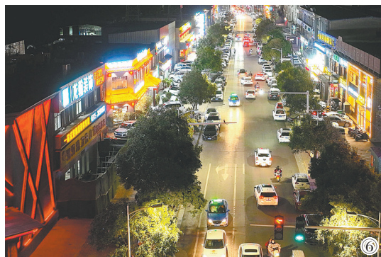
图①:沿途小区新建的智能充电车棚 图②:整洁有序的商铺门头 图③:网红墙前打卡 图④:景观墙前休闲乐 图⑤:路边游园内健身 图⑥:湛河南路夜景

小街道藏着大民生。城市在发展,时代在进步,湛河南路该怎么办?文明城市创建有要求,市民生活有期盼,湛河南路该怎么办?改造、提升!不仅改造提升,还要将其打造成示范街。