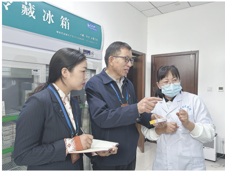
—舞钢市纪委监委深入开展医药领域腐败问题集中整治,坚决查处医疗领域腐败和不正当之风,切实维护人民群众利益。12月4日,该市纪检监察干部在舞钢市中医医院查看药品质量、保质期、储存方式等。