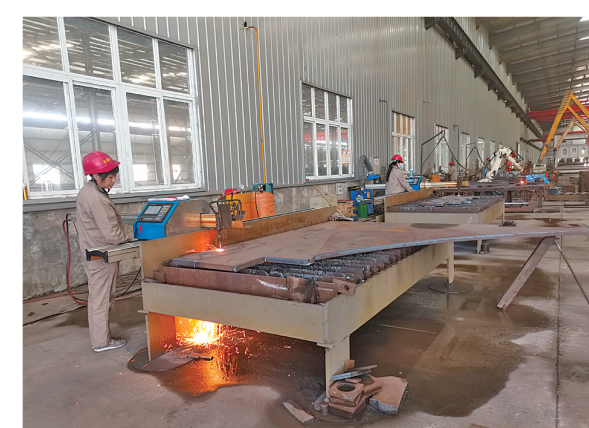
神州重工生产线