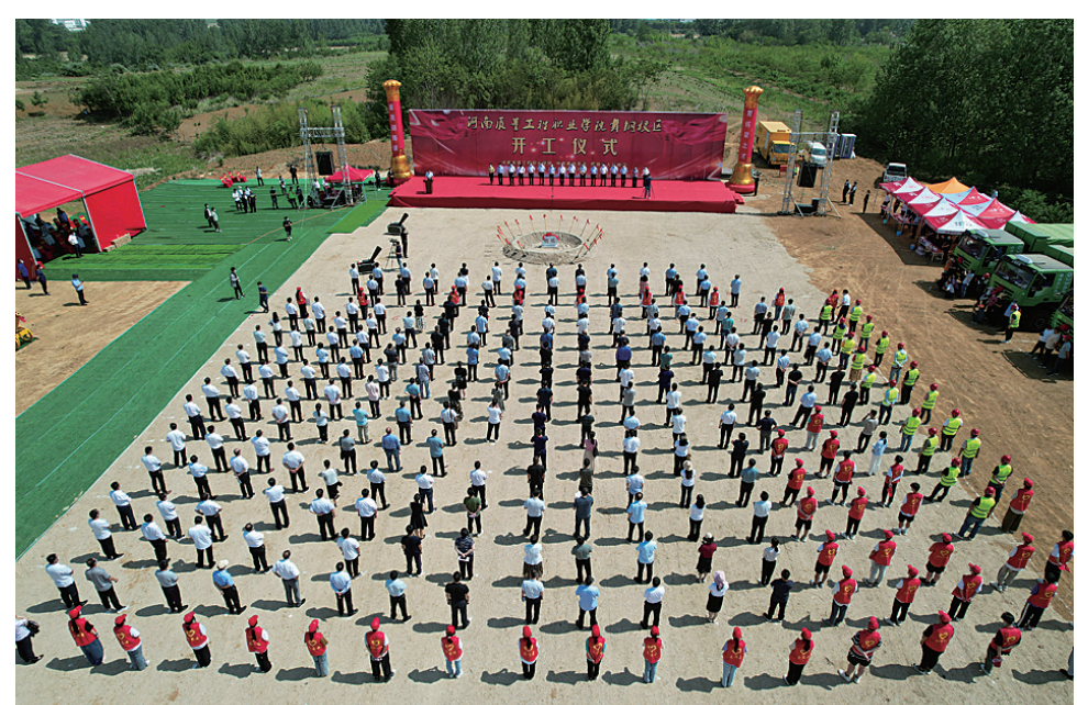
加强与高校院所合作

德正新材料有限公司聚焦高分子新材料项目，主要依托河南省硅碳新材料与平顶山尼龙新材料产业布局，以现有泰田重工公司生产装备的技术优势实施延链、补链、强链，重点围绕热塑性复合材料、片状成型复合材料、热固性塑料材料、彩涂钢板复合材料等先