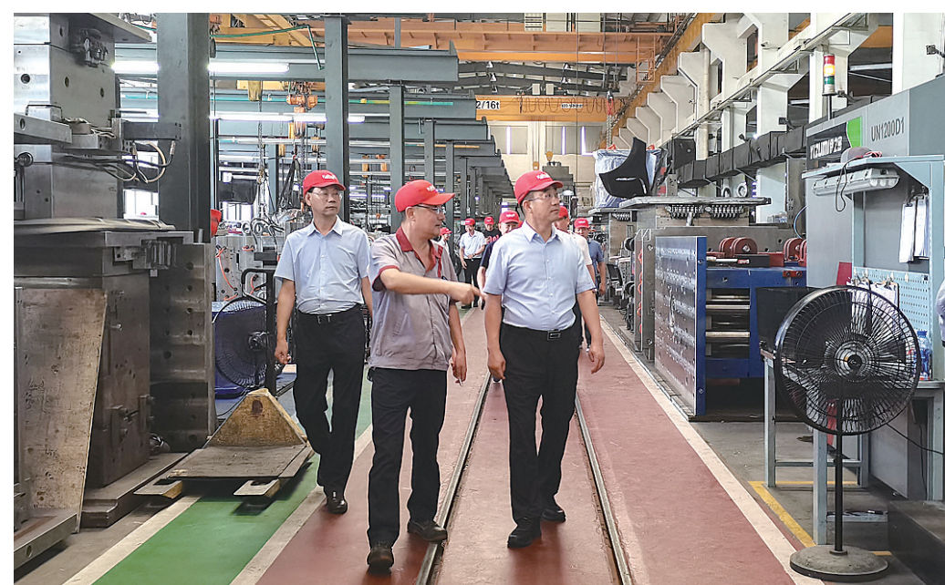
围绕特钢产业精准招商

强化增量扩增量，在产业发展上激发活力。该市通过服务现有企业强存量，深入开展“万人助万企”等活动，推动现有企业快速成长壮大。神州重工公司成为国内爆炸复合板领军企业，舞钢公司研发成果两次获得国家科技进步一等奖，泰田重工公司等3家企业获评“瞪羚企业”，天成铝业公司等3家企业成为省级“专精特新”企业，神州重工公司获评国家级专精特新“小巨人”企业。2022年，该市新增规模以上工业企业14