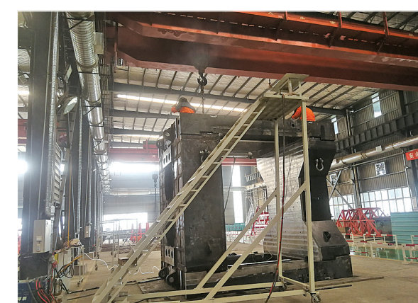
泰田重工液压机装配车间