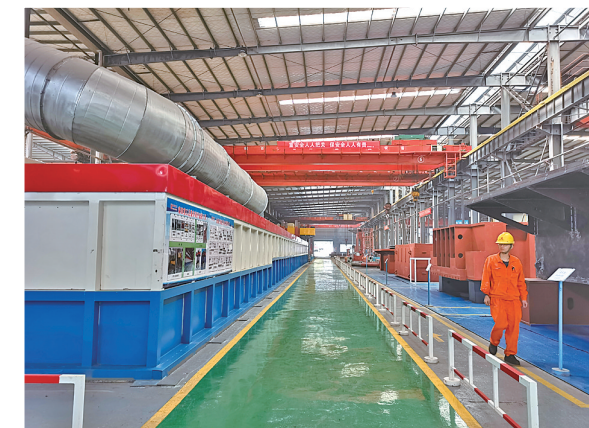
泰田重工标准化车间