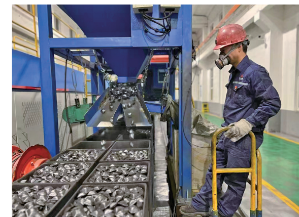
钢芯铝及铝合金新材料生产线