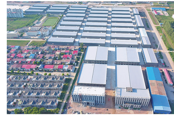
舞钢经开区标准化厂房