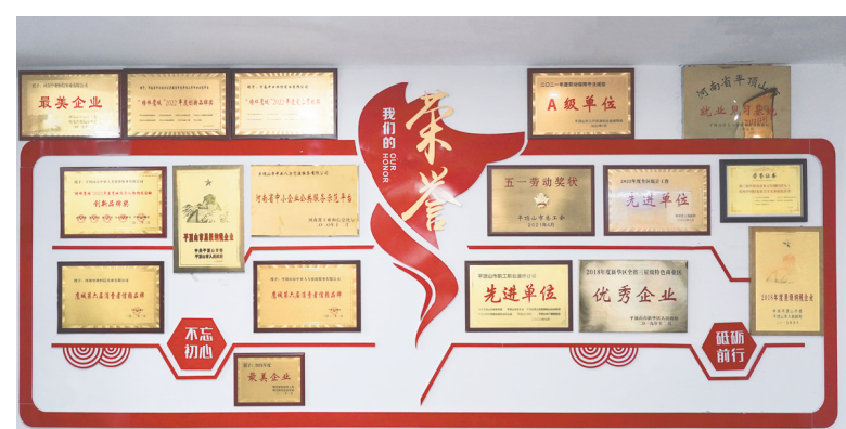
平顶山中业中小企业公共服务平台荣誉墙

中共中央、国务院关于加强新时代老龄工作的意见中指出,鼓励老年人继续发挥作用。把老有所为同老有所养结合起来,完善就业、志愿服务、社区治理等政策措施,充分发挥低龄老年人作用。在学校、医院等单位和社区家政服务、公共场所服务管理等行业,探索适合老年人灵活就业的模式。鼓励各地建立老年人才信息库,为有劳动意愿的老年人提供职业介绍、职业技能培训和创新创业指导服务,全面清理阻碍老年人继续发挥作用的有关规定。