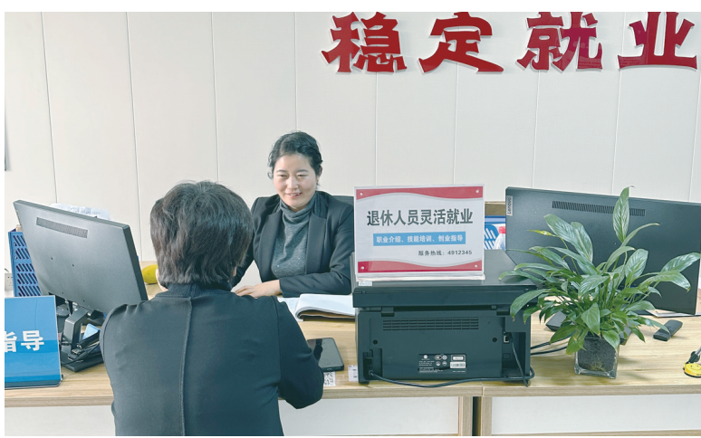
退休市民咨询就业相关事宜