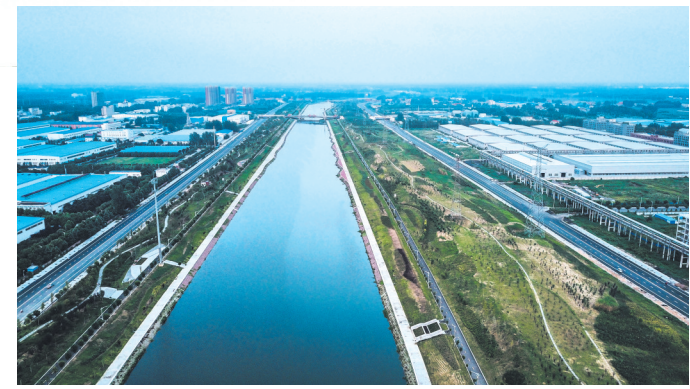
湛河新貌