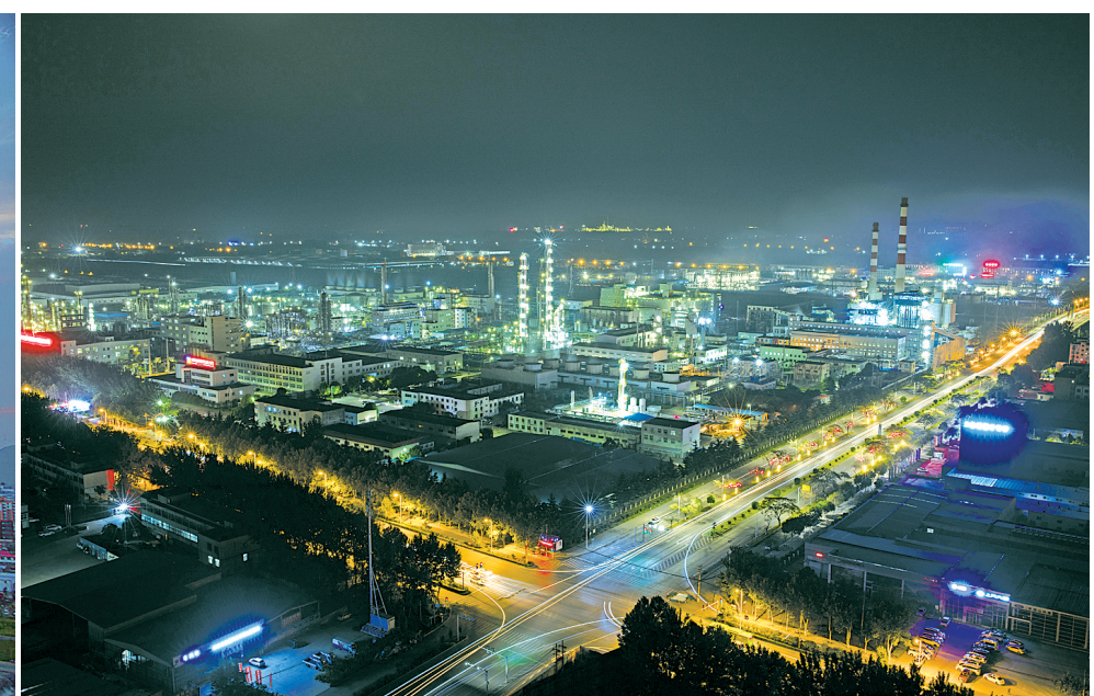
绚丽夜景