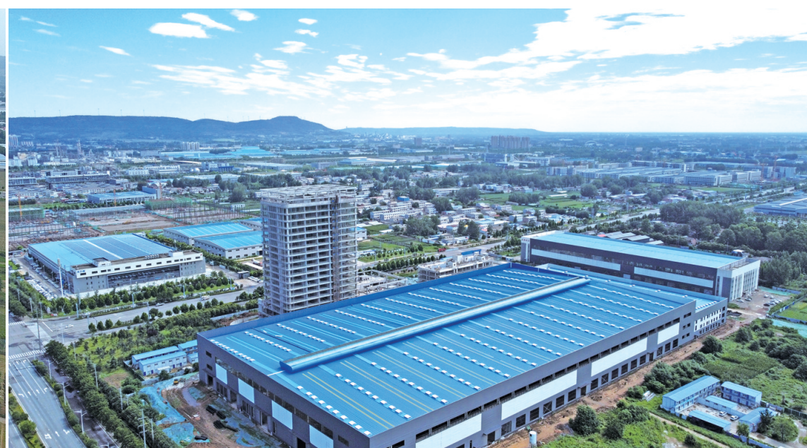
跨境电商产业园