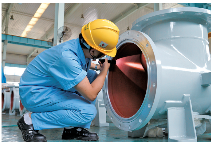
验收产品

服务能力的专业团队承担智慧岛后续运营工作,瞄准智慧岛“三空间二平台一示范”功能定位,与高新区产业发展、空间规划、创新发展要求紧密结合,与中国尼龙城创新产业园项目衔接联动,加速谋划商业银行科技支行落地,建立平顶山市绿色产业投资基金,打造辐射全市的科技金融公共服务平台,打造各类创新要素高度集聚、业态功能布局完善、体制机制更加灵活的“创新特区”。