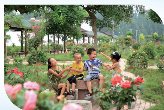
乐享生活

前三季度,高新区累计签约项目39个,总投资116.06亿元,实际到省外资金48.75亿元;省、市重点项目投资分别完成全年目标任务的109.9%和94.3%。