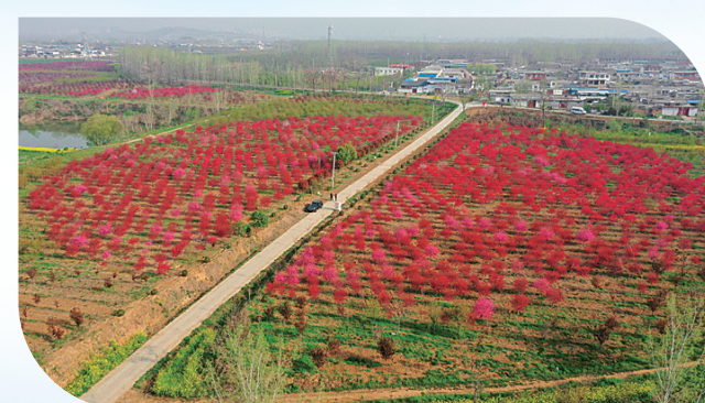
美丽花海