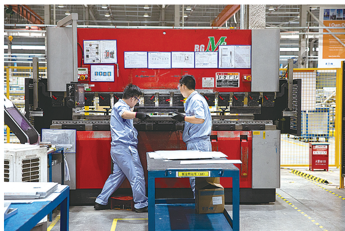
生产车间

全面深入推进智慧岛建设。该区锚定融入郑洛新国家自主创新示范区战略目标,引进实力强大、具有双创运营经验和较强科