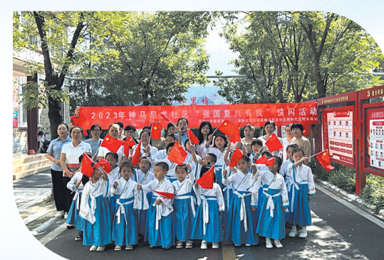
传承文化