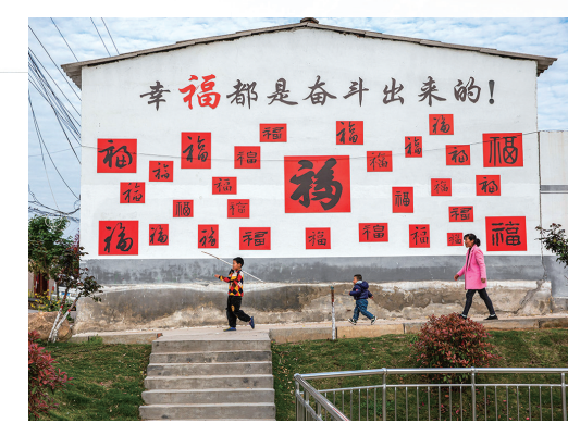
创意涂鸦