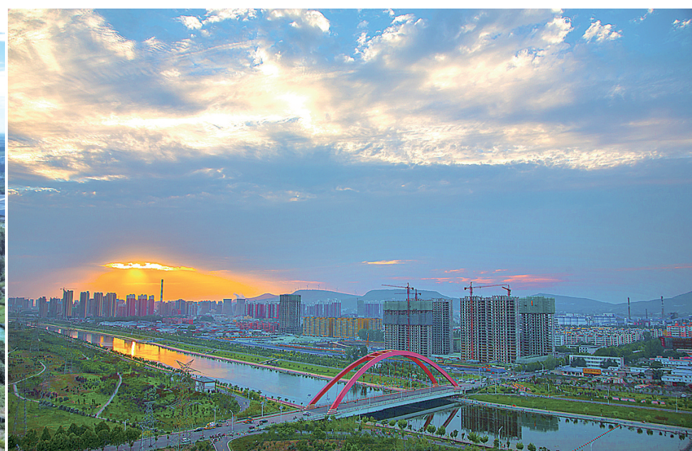
风光驰骋