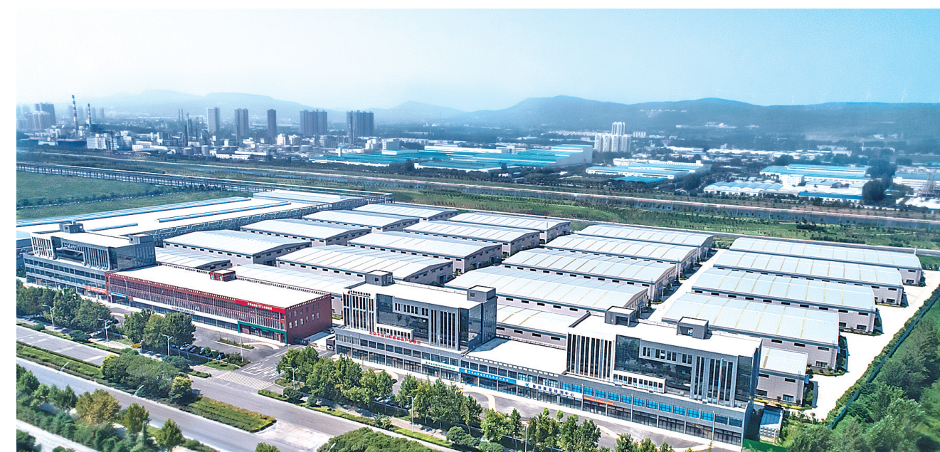
高新火炬园