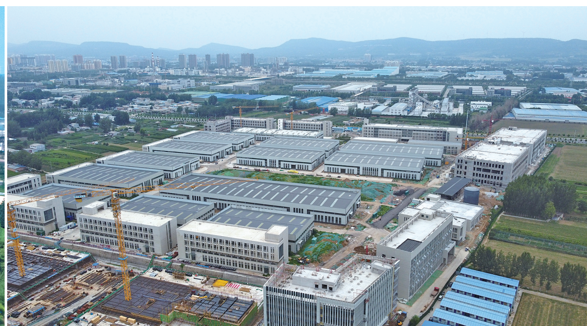
尼龙智造产业园