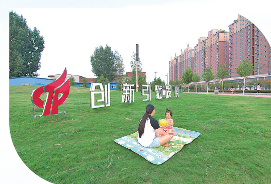
休闲娱乐