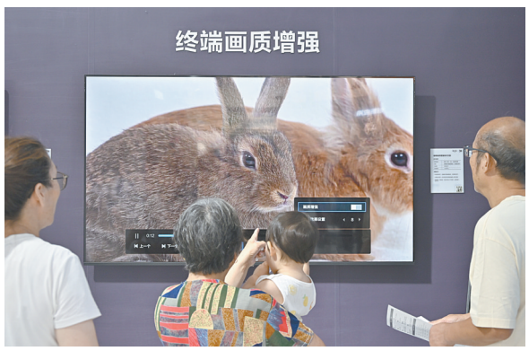
参观者在观看采用终端画质增强技术的显示器画面