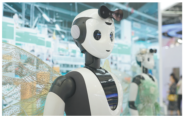
人形智能服务机器人