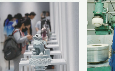
宝丰汝瓷通过各类展览集中对外展示汝瓷陶瓷产业发展新面貌,传统汝瓷摆件、创新汝瓷作品、文创汝瓷配饰等再次刷新宝丰汝瓷热度。