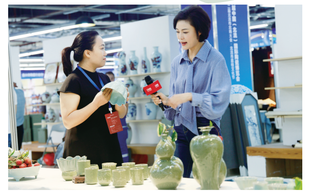
宝丰汝瓷亮相广西北流国际陶瓷博览会,接受中央电视台直播团队专门采访。