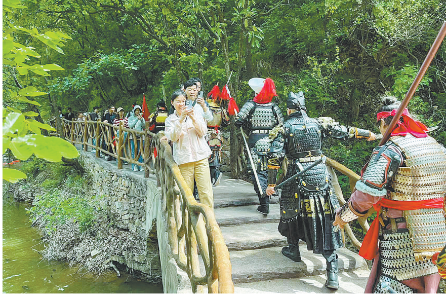
汝州九峰山景区举办“甲冑表演秀”活动。

据介绍,我市坚持“颠覆性创意、沉浸式体验、年轻化消费、移动端传播”理念,以创新消费场景、创新差异化体验为支撑,以春赏花、夏玩水、秋赏叶、冬滑雪·沐温泉系列活动为“引爆点”,依托平顶山全域智慧文旅平台抓取的大数据,编辑和制作了一批短视频,通过微信、抖音等社交媒体,以最时尚、最潮流的方式,面向全国宣传推介鹰城文旅资源,助推旅游发展。