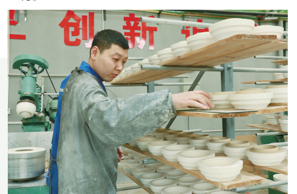
宝丰县中汝廷杯窑技术工人正在生产车间操作辊压设备,制作汝瓷坯体。