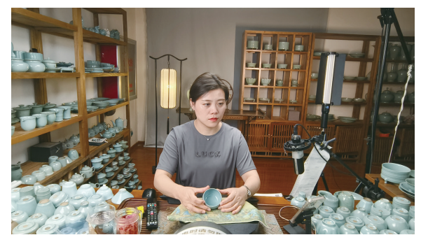
宝丰汝瓷官方直播间正在抖音平台销售宝丰原产地汝瓷。