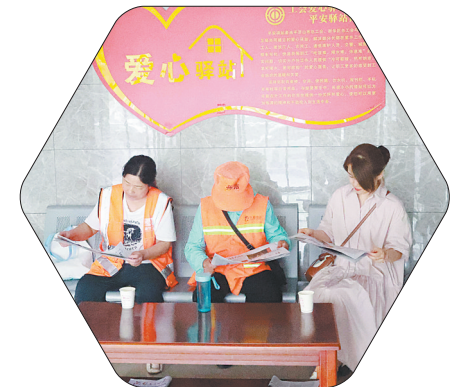
环卫工人在“爱心驿站”乘凉