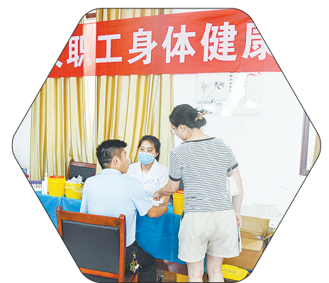
市总工会开展职工体检活动

健全防暑降温工作制度，制定防暑降温工作方案和高温中暑应急预案，开展应急救援演练”深入开展防暑降温监督检查，督促用人单位合理布局生产现场，改进生产工艺和操作流程，合理安排作业时间，适当增加高温工作环境下职工休息时间和减轻劳动强度，为职工提供必要的个人防护用品和高温作业休息场所，按规定发放高温津贴，确保各项保障措施落到实处，最大限度减少劳动者高温中暑事件的发生。