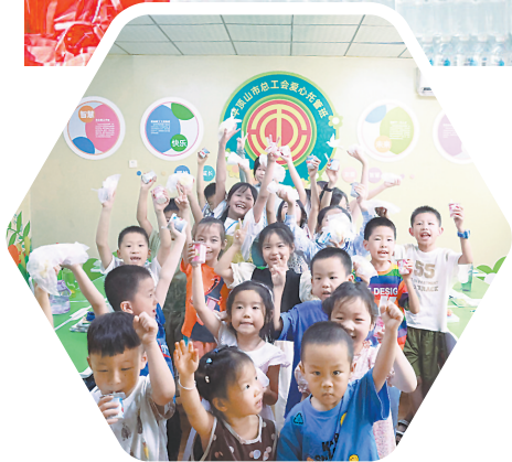
市总工会暑期爱心托管班开班