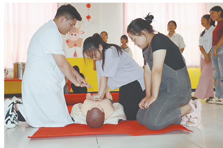
防溺水培训进校园

全国各地符合条件的考生积极踊跃报名。此次公开招聘,涉及该区综合办公室、区党群工作部、区科技创新局及遵化店镇、皇台街道办事处等17个部门。据统计,此次招聘初步报考人员达3200余人,通过资格审查、确认等各项环节,最终2418人符合条件参加考试。