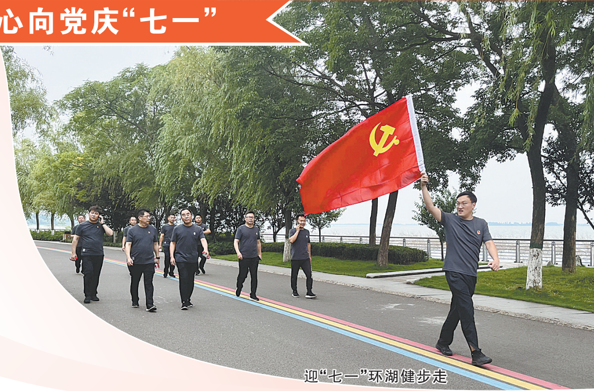
迎“七一”环湖健步走

红心向党庆“七一”，踔厉奋发再起航。为庆祝中国共产党成立102周年，我市各银行机构开展了慰问老党员、表彰先进党员、环湖健步走等形式多样的主题活动，激励引导广大党员弘扬伟大建党精神，永葆初心本色，强化使命担当，发挥好党组织的战斗堡垒作用和党员的先锋模范作用，以更加果敢的决心、更加奋进的姿态、更加扎实的举措，推动银行各项业务高质量发展，为我市“壮大新动能、奋进百强市”贡献金融力量。