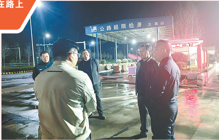
市委第七巡察组工作人员在对梳理出的问题进行分析研判