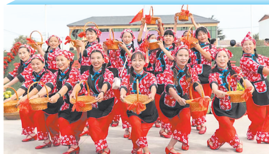
农民丰收节抒写喜悦心情

2022年，该市生产总值完成173.99亿元，三次产业结构比重为7.5:57:35.5；规上工业增加值增长16.3%，固定资产投资增长31.1%，增速均居平顶山各县（市）首位；社会消费品零售总额完成54.3亿元；一般公共预算收入完成17.5亿元，城镇居民人均可支配收入39080元，农村居民人均可支配收入19807元。今年一季度，该市地区生产总值完成45.3亿元、同比增长11%，规上工业增加值同比增长26.2%，增速均居平顶山各县（市）首位；社会消费品零售总额同比增长7%，增速居平顶山各县（市）前列。