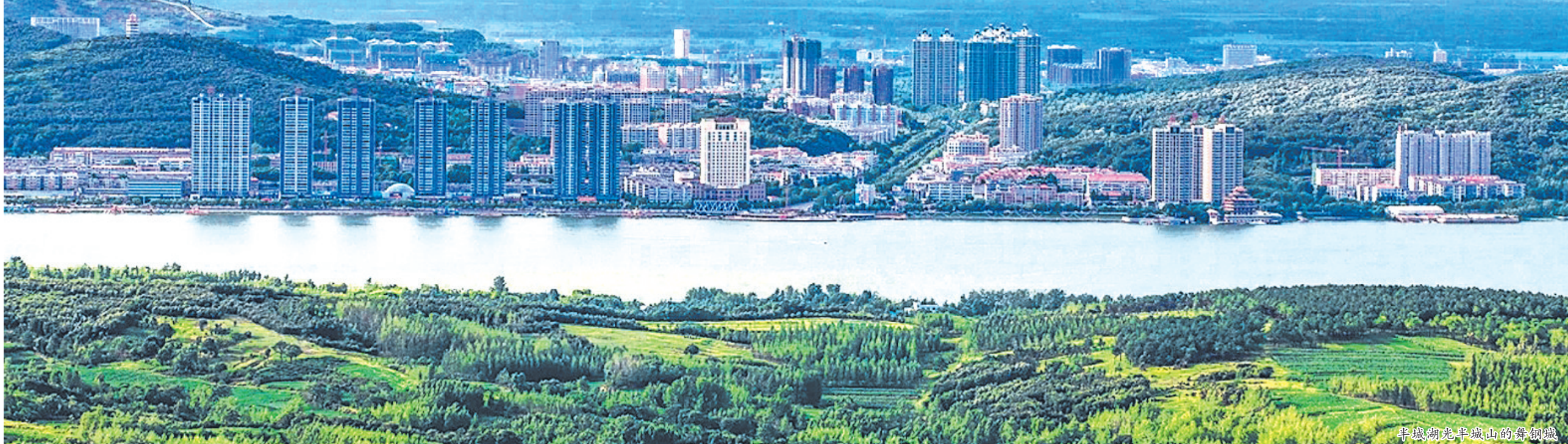
半城湖光半城山的舞钢城