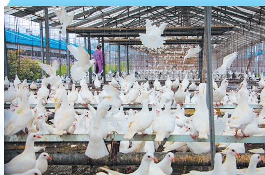
依托天成鸽业公司龙头创建“中国鸽都”

该市牢固树立“大抓产业、抓大产业”的发展导向，围绕“一黑一白一绿”三大主导产业延链补链强链，并遵循这一路径打造产业转型发展示范区，争当县域经济“成高原”的排头兵。