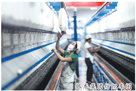
银龙集团纺织车间

远来”的旅游休闲度假胜地，促进旅游业快速复苏。围绕“景区游”“民宿游”“工业游”“康养游”“红色游”“科技游”，推动二郎山、灯台架、祥龙谷等4A级景区提档升级。围绕九头崖、五峰山、九龙山精准招商，让老景区更精、新景区更多，让民宿成为舞钢旅游新“代言”；持续举办水灯节等特色节会活动，力争全年接待游客660万人次，实现旅游收入40亿元。同时，加快培育现代农业，围绕“鸽、茶、菌”持续发力，积极创建省级、国家级农业现代示范区，强力推动现代农业产业提速、提质、提优。