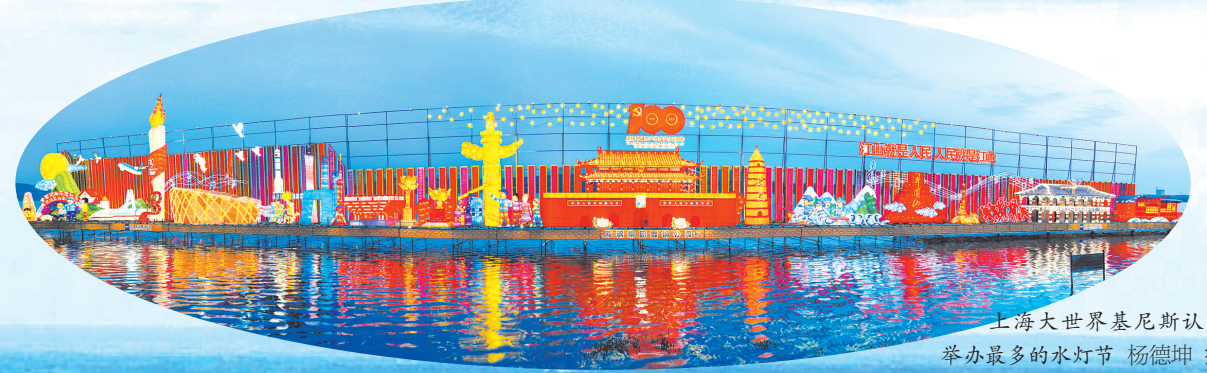
上海大世界基尼斯认定举办最多的水灯节 杨德坤 摄

新蓝图振奋人心，新征程催人奋进。乘着第一届中国尼龙产业发展大会召开的东风，舞钢市将紧紧抓住难得的发展机遇，坚定信心、开拓进取，发出“集结号”，吹响“冲锋号”，激励广大干部群众在高质量发展中更加奋勇争先，奋力谱写全面建设社会主义现代化现代化新舞钢的绚丽篇章。（本报记者 杨德坤） （本版图片除署名外均由舞钢市委宣传提供）