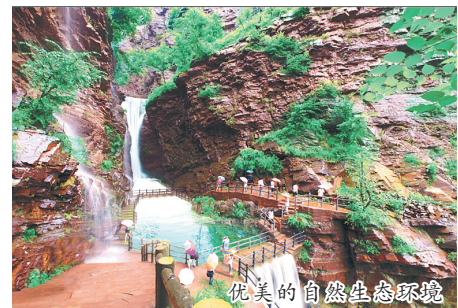
优美的自然生态环境