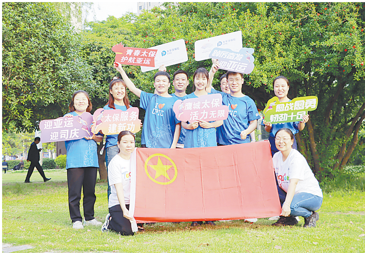
“迎亚运 迎司庆”健康跑

本报讯 为有效预防和打击洗钱犯罪活动,不断提高社会公众的反洗钱意识,净化社会环境,营造浓厚的反洗钱氛围,5月15日上午,农行平顶山分行结合“全国打击和防范经济犯罪宣传日”活动开展反洗钱宣传。 活动现场,该行工作人员通过悬挂横幅、摆放展板、设立咨询台、发放宣传折页等方式,向群众普及反洗钱知识,介绍电信网络诈骗、非法集资典型案例,了解做好个人账户管理、主动配合金融机构进行身份识别的重要性,提高群众反洗钱意识和防范诈骗能力。同时,提醒群众不参与洗钱活动,不出借出售身份信息及银行账户,获得了群众的广泛好评。此次宣传活动共发放宣传折页900余份,直接受众200余人。 本次宣传活动,向社会公众宣传了反洗钱知识,增强了反洗钱意识,提升了社会公众对洗钱犯罪活动的认知度和判断力,为反洗钱工作的有效开展营造了良好氛围。同时赢得了客户对开展身份识别工作的理解和支持,提升了公众自我保护意识和主动防范风险的能力。(郑岩 王宇飞)