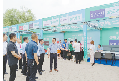
参展商家介绍企业情况