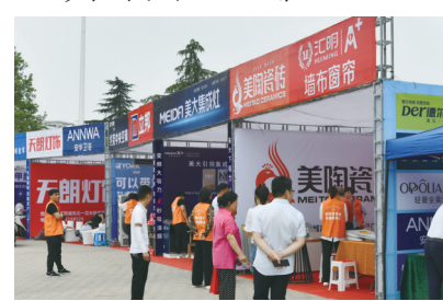
市民在家装建材展区参观咨询