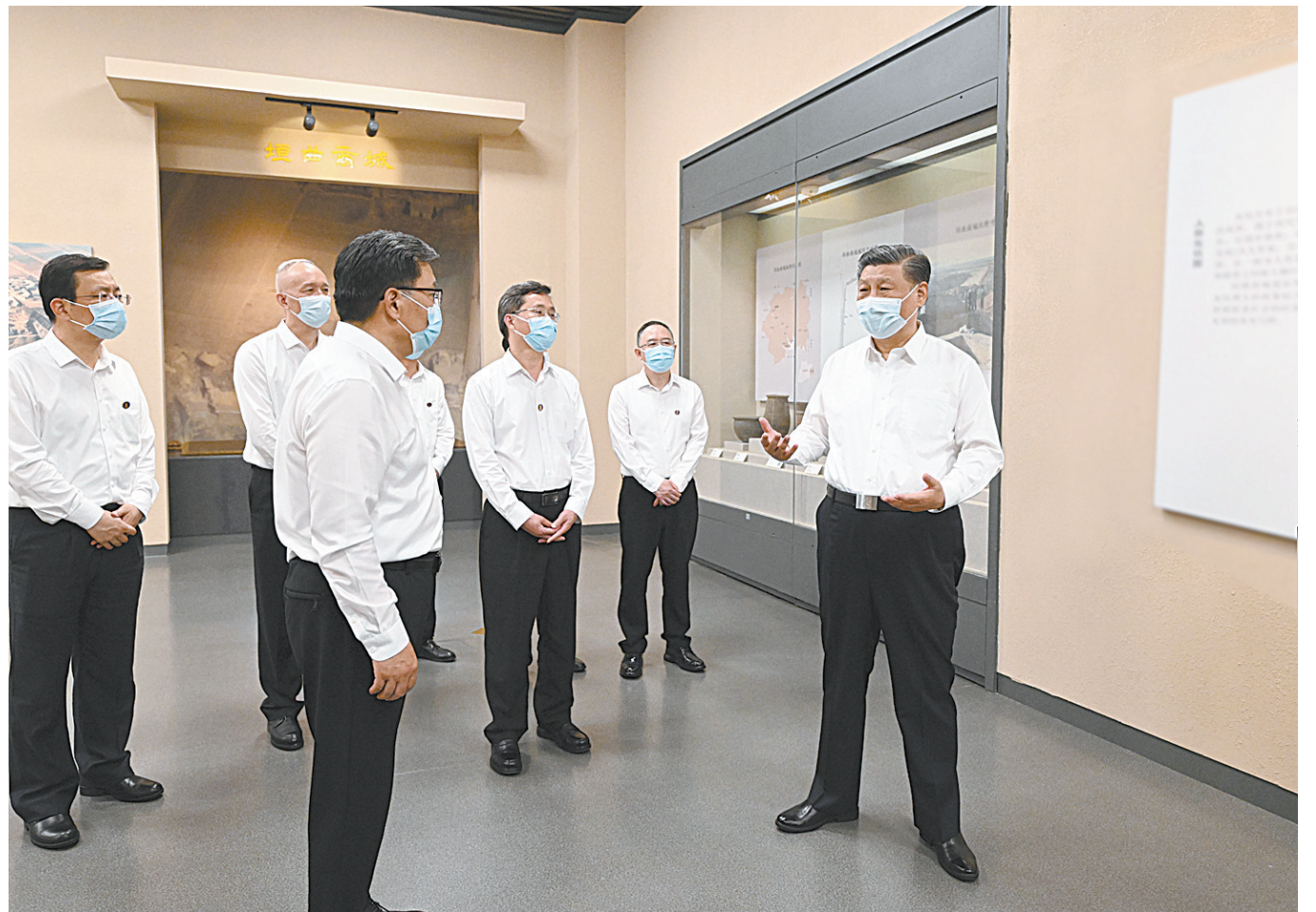
5月16日下午，中共中央总书记、国家主席、中央军委主席习近平在前往陕西西安主持中国-中亚峰会途中，在山西运城博物馆考察。

新华社陕西西安/山西运城5月17日电 中共中央总书记、国家主席、中央军委主席习近平在听取陕西省委和省政府工作汇报时强调，陕西在推进中国式现代化建设中要有勇立潮头、争当代弄潮儿的志向和气魄，奋力追赶、敢于超越，在西部地区发挥示范引领作用。要完整、准确、全面贯彻新发展理念，紧紧围绕高质量发展这个首要任务，着眼全国发展大局，立足陕西实际，发挥自身优势，明确主攻方向，主动融入和服务构建新发展格局，努力在实现科技自立自强、构建现代化产业体系、促进城乡区域协调发展、扩大高水平