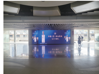
北京西站广告投放

随着热度的持续提升，本届糖酒会上，宝丰酒业将以崭新的品牌形象、强大的品牌势能，吸引全国市场、经销商和消费者的关注，掀起新一轮的品牌热度，进一步推动宝丰酒业全国化进程，助力宝丰名酒复兴。(张五阳)