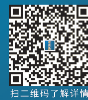
扫二维码了解详情