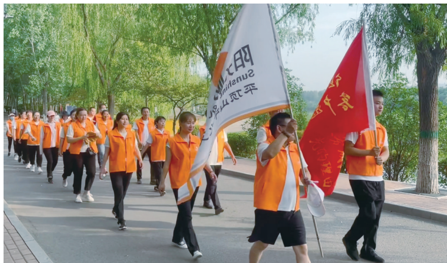
2022年7月,该公司开展“7·8全国保险公众宣传日”环湖徒步走活动。