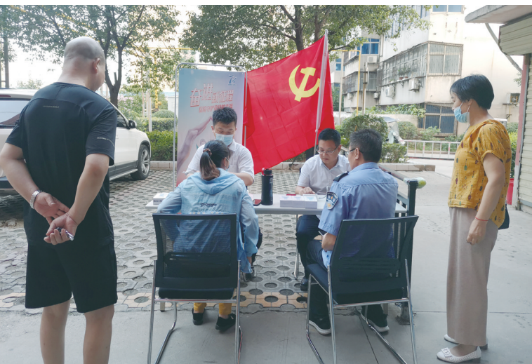
2022年7月,该公司员工进社区为老年人提供保健服务,宣传保险知识。