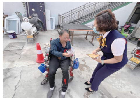
2022年9月,该公司在湛河区北渡街道综合养老服务中心开展“学雷锋 送温暖”活动。