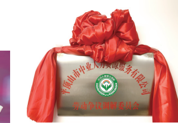
成立劳动争议调解委员会