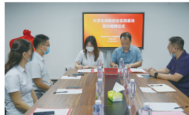
与平顶山学院合作签约