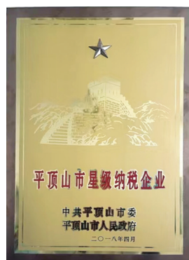
市星级纳税企业奖牌