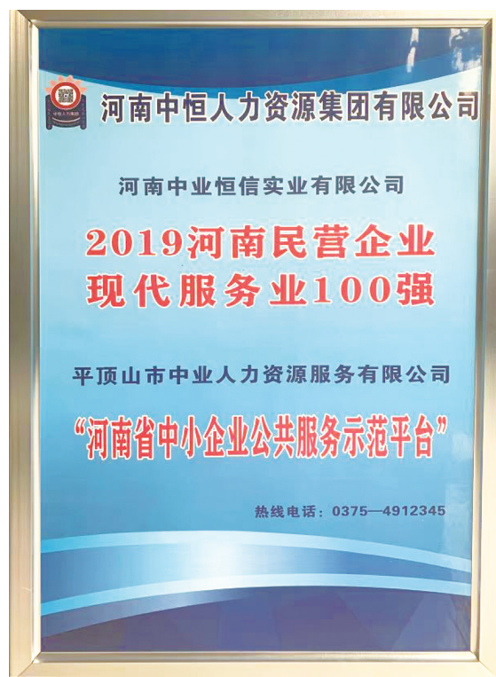
2019年度河南民营企业现代服务业百强奖牌

用好政策、用心服务。平顶山中业及其示范平台干得实、走得稳,也取得一系列荣誉。仅去年,该公司就获评“平顶山市2021年度工业经济发展先进单位和先进企业”“鹰城第六届消费者信赖品牌”“榜样鹰城”2021年度鹰城经济人物推选活动创新品牌奖等。