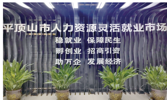
河南中业恒信服务理念墙