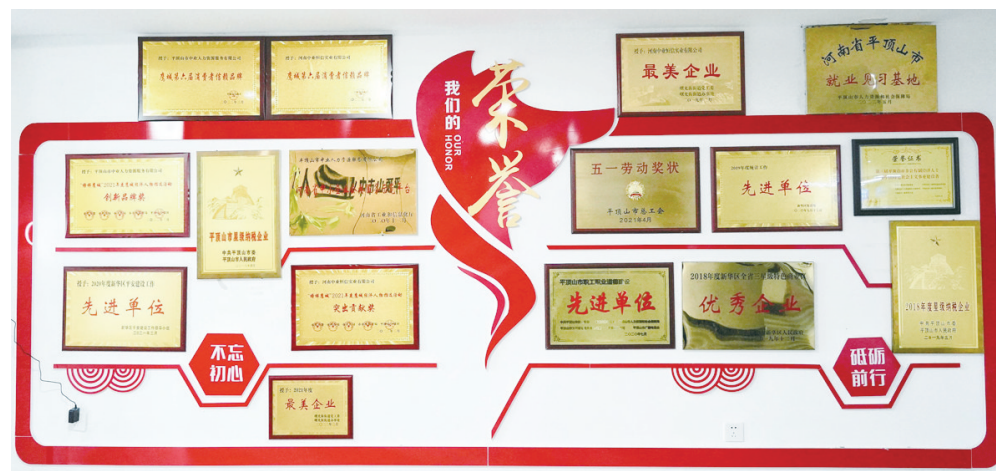
平顶山中业示范平台荣誉墙

在我和新华区有关单位及部门的指导下,去年4月6日,新华区第四期“三个一批”重大建设项目平顶山中业示范平台项目正式开工。该项目由平顶山中业投资运营,占地1730平方