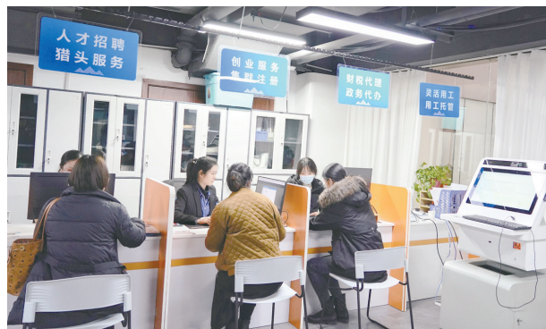
创业者在平顶山中业示范平台大厅咨询

中小企业要发展得好,和谐劳动关系少不了。由市中仲裁委与新华区仲裁委牵头,平顶山中业成立了劳动争议调解委员会,为平顶山中业示范平台帮助企业合规用工提供了方便。去年4月以来,该平台每周四推出“一起益企”中