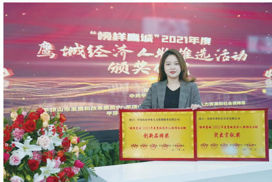
在“榜样鹰城”2021年度颁奖典礼上领取奖牌