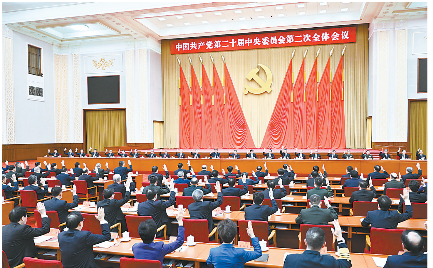
中国共产党第二十届中央委员会第二次全体会议,于2023年2月26日至28日在北京举行。中央政治局主持会议。