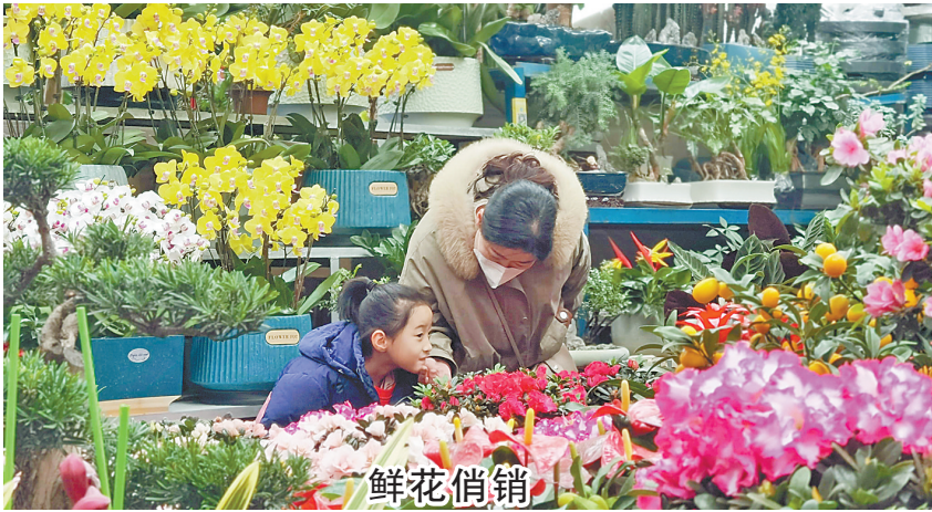
1月12日，市民在建设路东段花卉市场选购花卉。春节临近，我市花卉市场升温，鲜花为即将到来的兔年春节增添了喜庆气氛。

城市广场及路边点位中，鹰城广场、火车站广场，部分存在果皮箱爆桶、地面破损、志愿者服务岗无人值守等问题。公园景区及周边点位中，白龟湖国家湿地公园（喷泉广场周边）灭火器巡查记录未及时更新，观光车长期占压广场（已多次通报），黄土裸露，地磚破損，