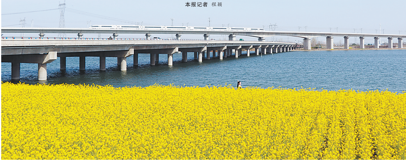
一列高铁从郑万铁路北汝河畔飞驰而过(资料图)