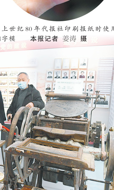
报社新闻工作者代表在报史馆参观1974年生产的圆盘平压印刷机