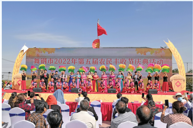
热闹的农民丰收节现场