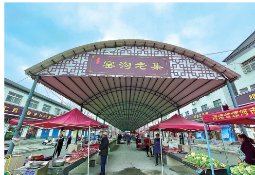
焕然一新的百年集市