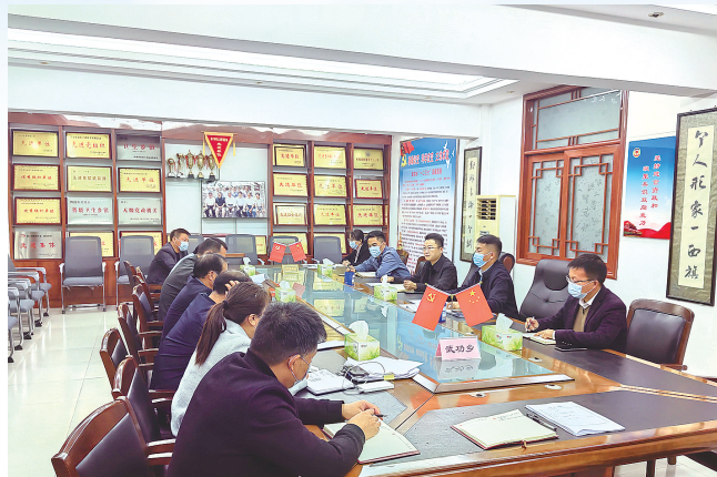
武功乡常态化开展工作日研判