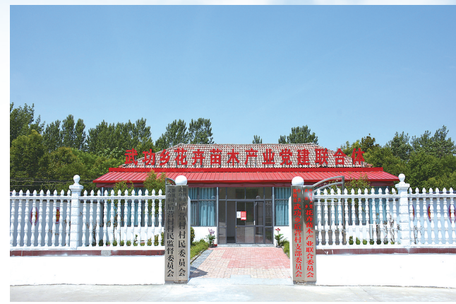
党建联合体成为产业发展桥头堡