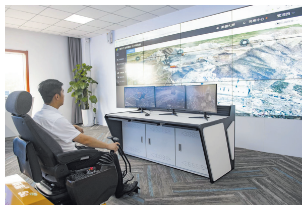
技术人员在河南跃薪智能机械有限公司远程控制室遥控位于焦作的5G智能挖掘机开采矿石

坚持党建业务融合一体化，锻造“红色引擎”。实施“书记工程”，各党支部书记向公司党委签订军令状，党建主题活动助推经营发展作用进一步彰显。扎实开展“实事暖人心 创新争先锋”活动，按阶段做实14个实事及创新项目，为实现全年工作目标提供有力保证。把“党建和创、和格行动”作为实现党业融合的重要载体，推动“两和”升级落地落实。目前，该公司各级党组织已陆续与39家单位签订和创协议，签订项目数40个，签约收入达到416.25万元。网格自有党员达到73名，覆盖网格42个，自有党员网格占比77.78%，较上年度提升12个百分点。