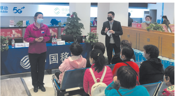
平顶山移动开展反诈宣传月活动

平顶山移动积极落实国家关于“提速降费”的要求，在先后取消手机国内长途、漫游费与流量国内漫游费后，全面下调流量价格，推出百元内5G套餐，落实中小企业宽带和专线2022年平均再降费10%的要求等。