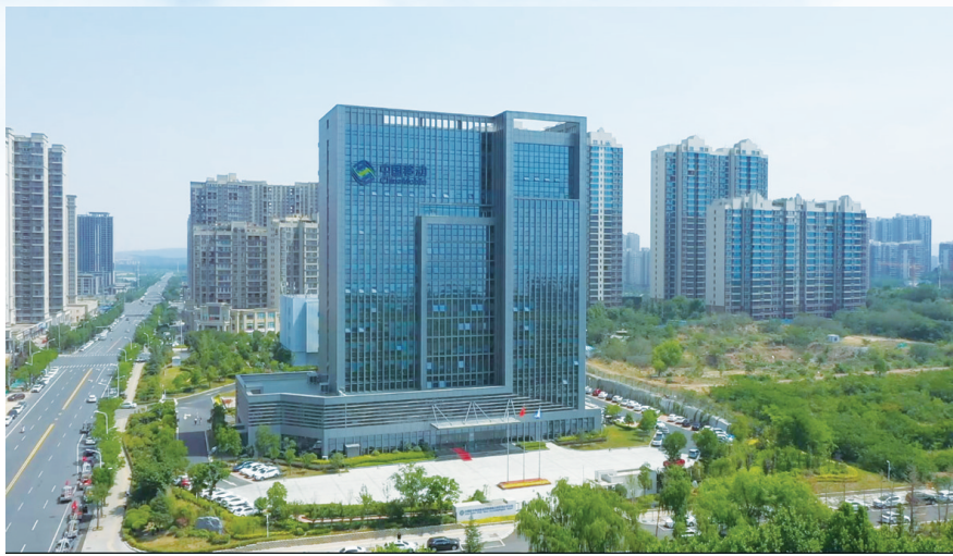
平顶山移动公司办公大楼