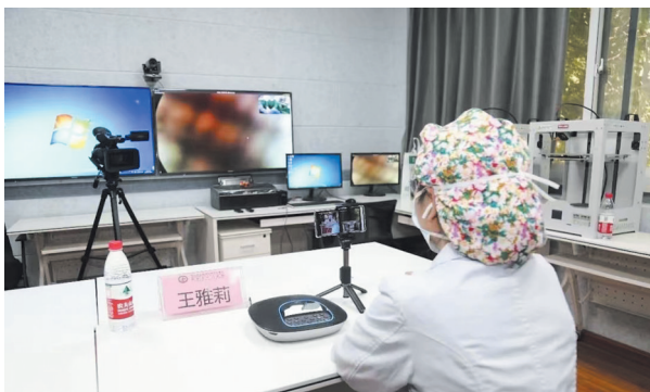
郟县妇幼保健院利用5G网络开展远程医疗手术

去年12月，在工信部组织的“绽放杯”5G应用征集大赛中，平顶山移动5个项目获奖，获奖率100%，其中，一等奖1个、三等奖3个。入围“绽放杯”总决赛项目1个，获得全国总决赛一等奖，奖项名次位居全省第一。