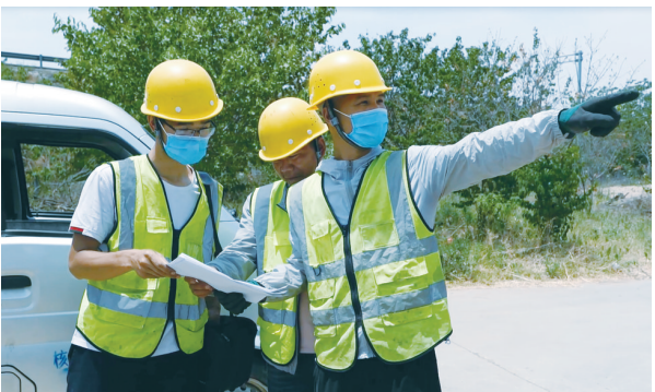
平顶山移动网络维护人员巡检线路保网络畅通