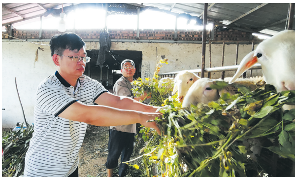
平顶山移动驻村第一书记帮扶村民发展养殖业