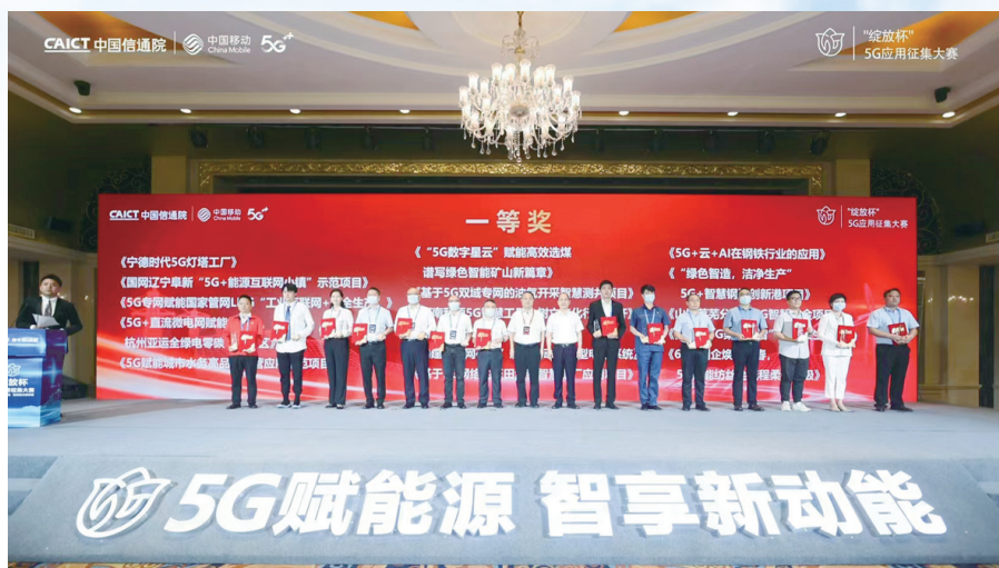
平顶山移动公司申报项目获第五届“绽放杯”智慧能源专题赛一等奖