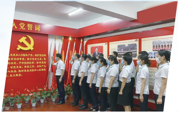
工行平顶山矿区支行党支部开展主题党日活动