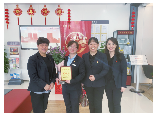
工行平顶山分行工会为获评省行“最美家庭”的员工颁发奖牌