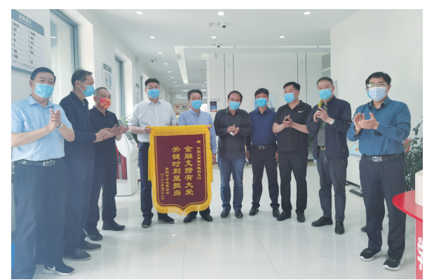
舞钢市企业家协会向工行舞钢支行赠送锦旗