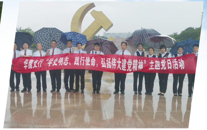
工行平顶山华鹰支行党支部开展主题党日活动