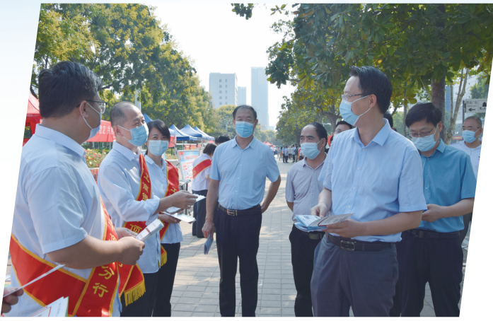
工行平顶山分行开展金融知识宣传月活动