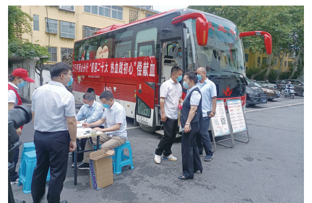
工行平顶山分行组织开展无偿献血活动