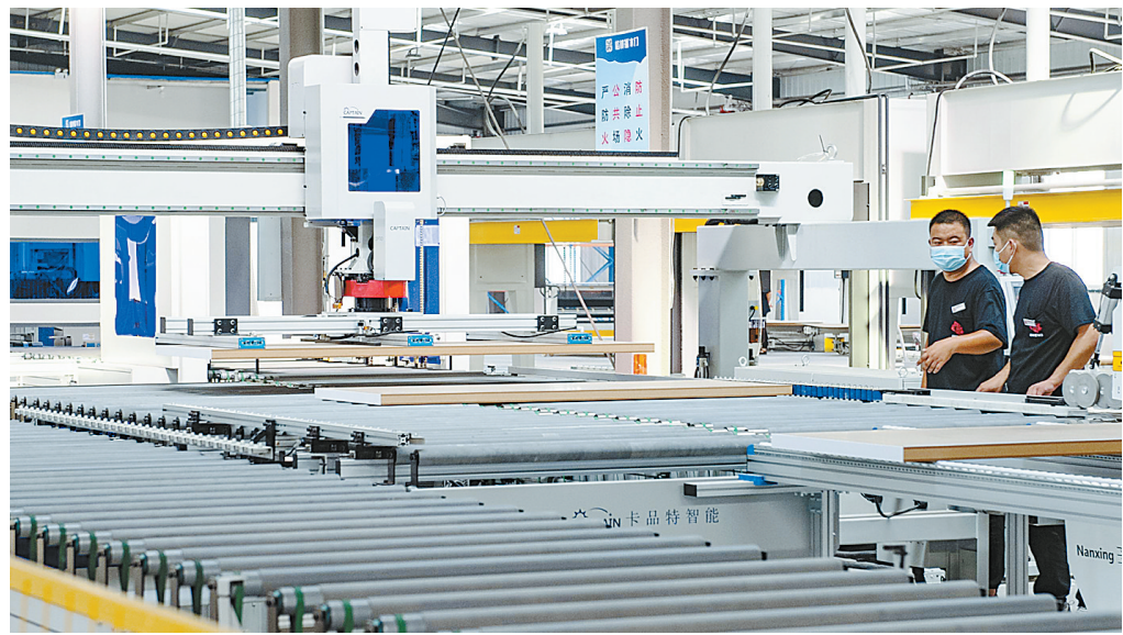
8月12日,工人在车间内加工板材。

顶山汝瓷文化保护发展提供有力法治保障。 随后,市人大常委会召开基层立法联系点观摩总结表彰暨立法工作培训会,组织部分基层立法联系点进行经验交流,表彰先进单位,并邀请李哲就加强基层立法联系点能力建设、做好地方立法工作专题培训报告。 李哲围绕设立基层立法联系点的目的意义、基层立法联系点的职能、如何更好发挥基层立法联系点的作用、怎样做好地方立法工作4个方面,对与会人员进行了辅导培训。