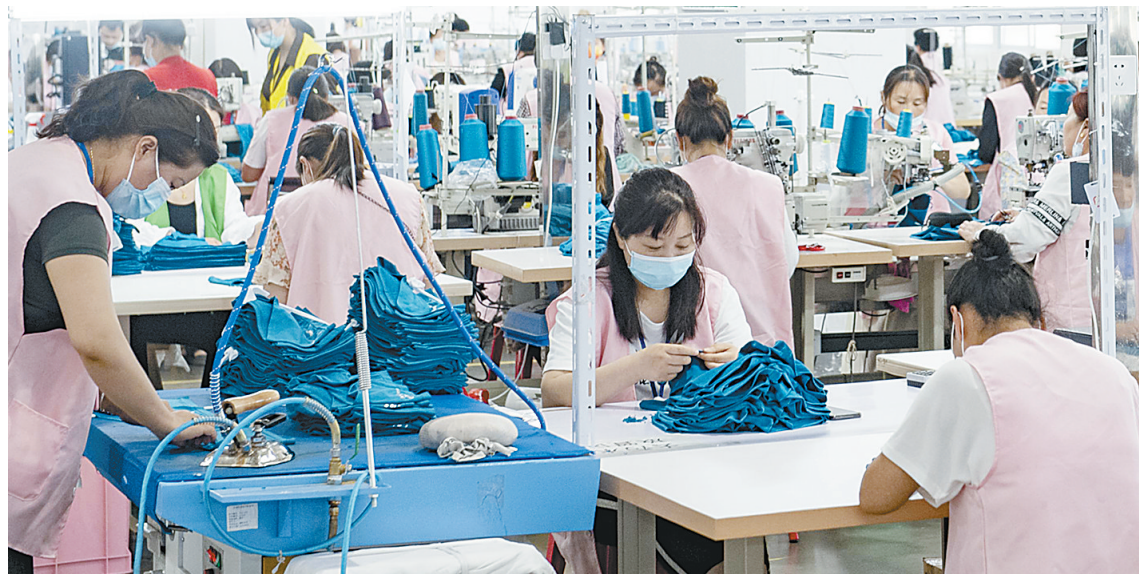
8月10日,工人在叶县纺织服装产业园车间加工成衣。

此次集中整治行动包括“治脏”“治乱”“治差”“治危”“治露”“治暗”“治缺”“治本”八项整治重点,计划在8月底前大头落地,9月15日前除长安大道绿化工程以外的所有整治项目全部完工,短期内实现平顶山西站整体形象全面提升。 市创建全国文明城市指挥部强调,高铁站周边环境整治工作关系到广大市民的切身利益、平顶山市的对外形象,也直接关系到全市创文工作能否取得优异成绩。各责任单位、相关县区要进一步提升站位、夯实责任,围绕八项整治重点,拿出具体措施,强化资金保障,明确完成时限,高标准高质量推动工作落实见效。市创文办要根据责任分工和时间节点,加大督导力度,定期通报进展,督促各单位全力攻坚,按时保质完成各项整治任务,实现周边环境明显改善、整体形象全面提升。 启动仪式上,宝丰县、市城乡一体化示范区、平顶山西站的负责同志分别作了表态发言。