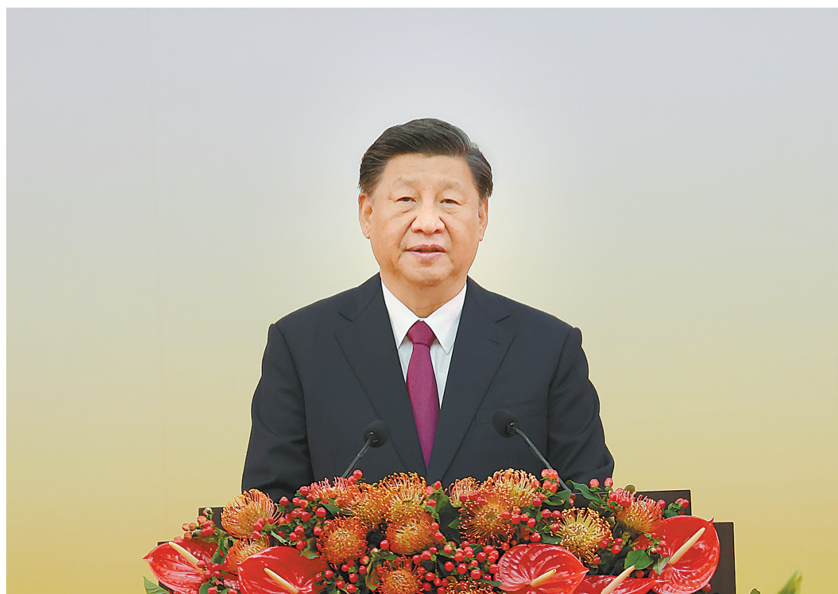
7月1日上午,庆祝香港回归祖国25周年大会暨香港特别行政区第六届政府就职典礼在香港会展中心隆重举行。中共中央总书记、国家主席、中央军委主席习近平出席并发表重要讲话。