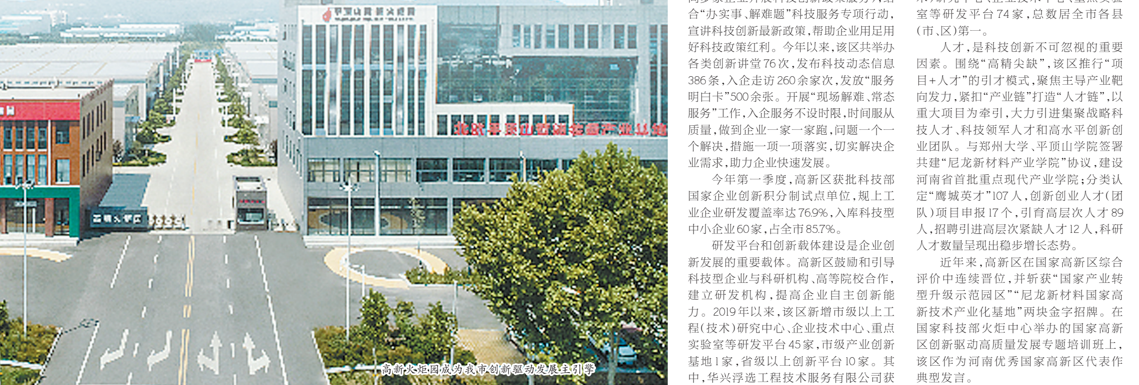
——高新区优化营商环境、提升服务效能，助推企业发展壮大

园区为提升营商环境，做到“快帮、准帮”，突出先行先试和落地见效，以实际行动诠释该区不断优化营商环境的决心和信心。企业带来更多实惠和便利。优化营商环境不难？难，因为这个系统工程，直面大量的企业和群众，涉及多个职能部门，往往一发而动全局，所以高新区的做法也很直接：园区叫喊，部门报到——从政府“端菜”转向企业“点菜”，“从我要怎么办”转向企业和群众“业该怎么办”。