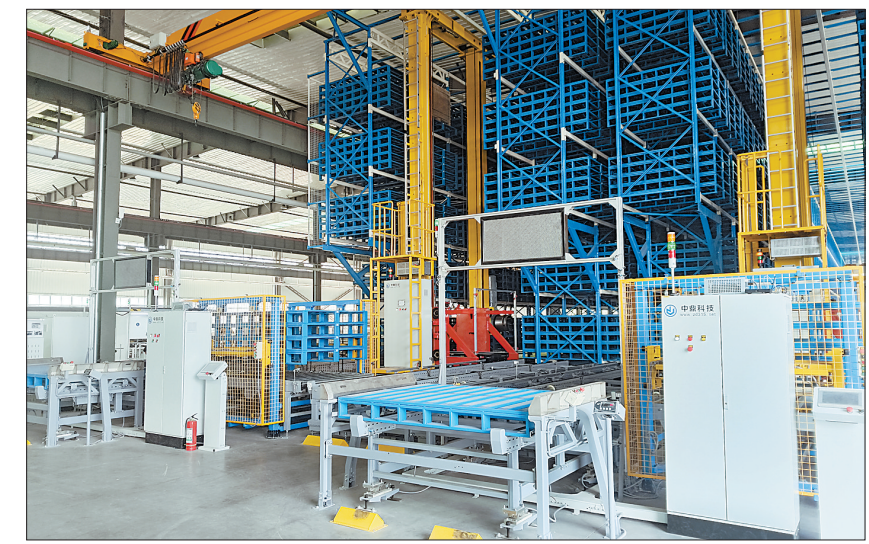
——平煤隆基项目生产车间