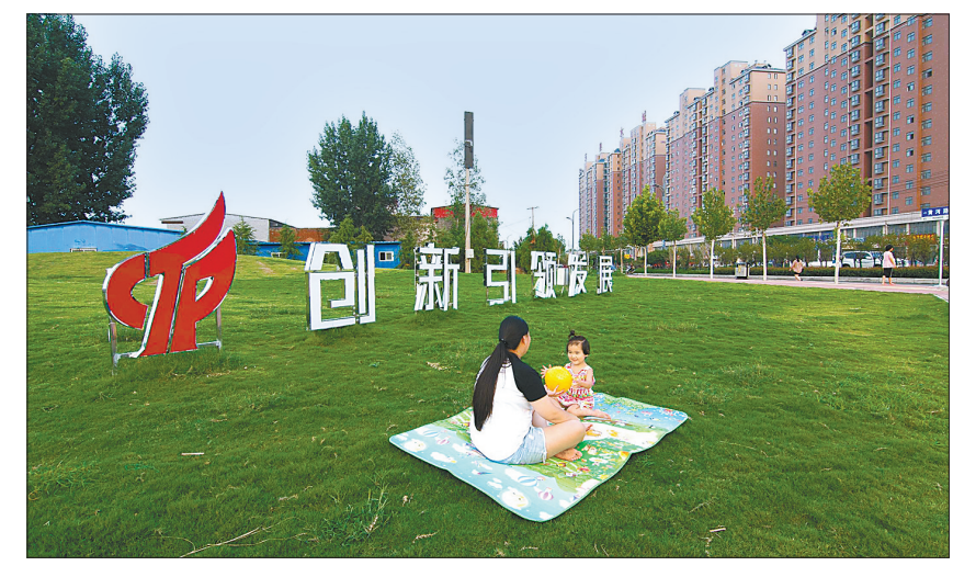
——环境优美、便民实用的游园