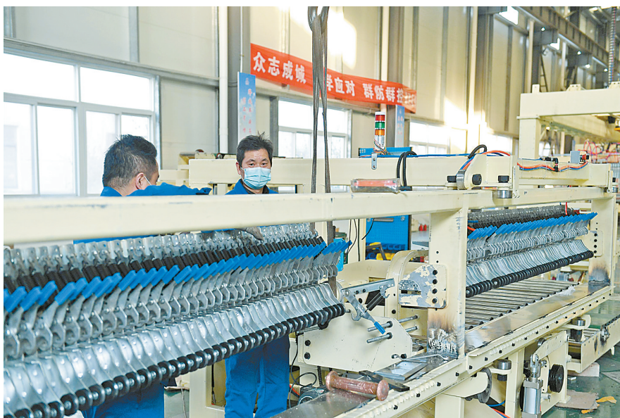
河南宾康智能装备有限公司员工在生产多功能高速码坯机。宾康机器人全自动码坯机、切坯切条机等装备智能制造项目位于平顶山高新火炬园,总投资5000万元。目前,公司已申请十多项专利。本报记者 牛智广 摄

在“万人助万企”活动中,市委、市政府向各级各部门明确提出要求——“不叫不到、有叫必到、无事不扰、有难必帮”,真正让企业感受到“雪中送炭”的温