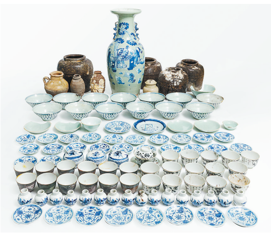
“长江口二号”古船部分出水文物(资料照片)。

中国高端制造和工程保障的“顶尖高手”。他们在探讨制定水下文物打捞方案过程中锐意求新,不断超越自我,让“科研攻关”与“水下考古”比翼齐飞,彰显“大国重工”的硬核实力与创新精神。