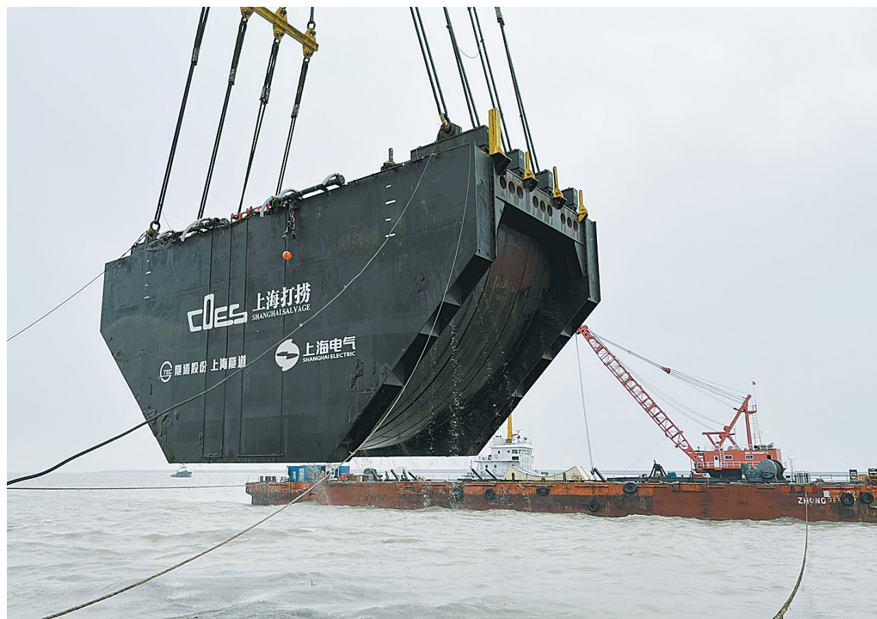
1月26日拍摄的“长江口二号”古船整体迁移项目等比例试验现场。

这支水下考古技术保障“天团”由交通运输部上海打捞局联合上海隧道股份、上海电气等企业组成,个个都是