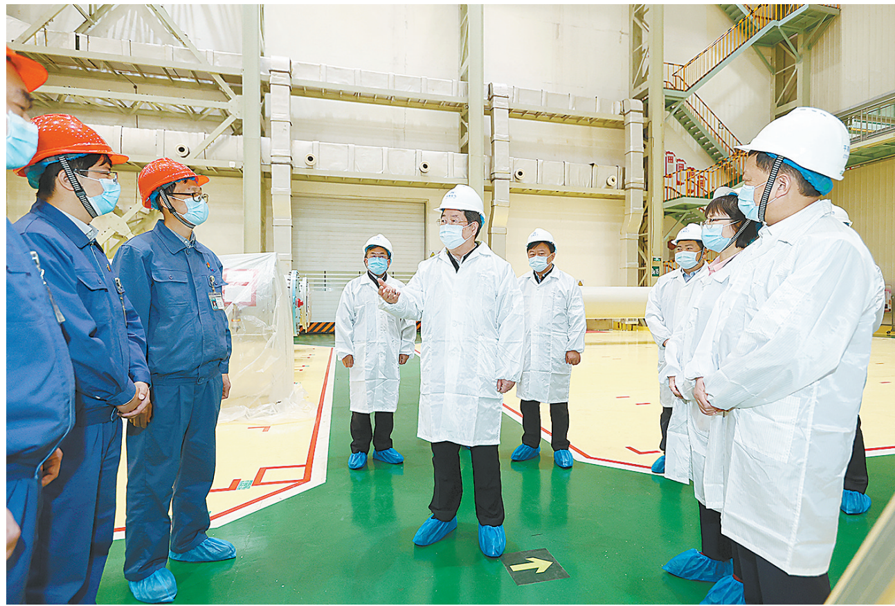
2月23日,省委书记楼阳生在平高电气股份有限公司调研高端智能电气装备研发制造情况。

中国尼龙城以煤化工、盐化工、尼龙化工为主导产业。在平煤神马尼龙科技有限公司,楼阳生了解科技研发和产业布局情况,强调要绘好产业链图谱,把补齐关键环节、解决“卡脖子”难题作为重中之重,集中资源重点突破,以补链强链、带链,提高产业核心竞争力。在平煤神马帘子布发展有限公司,楼阳生听取省尼龙新材料产业研究院建设情况汇报,指出要支持引导企业与省内外高校、科研院所开展合作,发挥好省科学院、中原科技城等新型研发平台作用,全面提高创新发展能力。